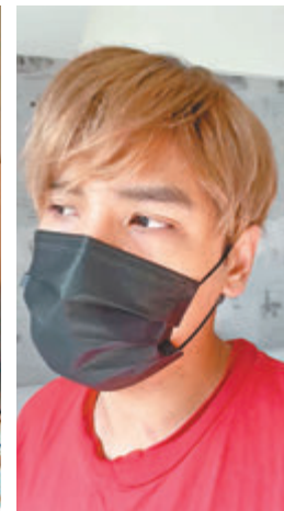
●陳零九坦然接受網友的批評。