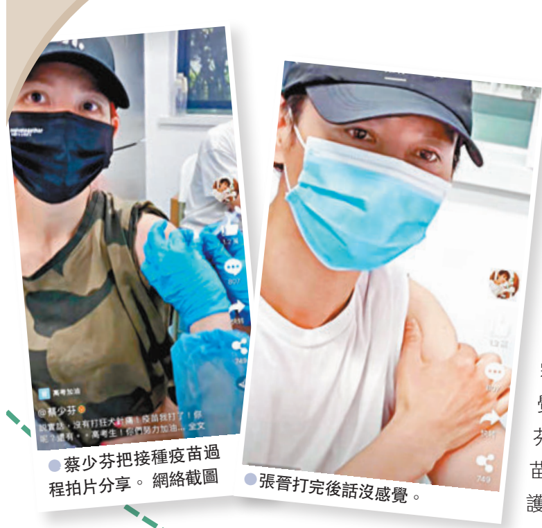
●蔡少芬把接種疫苗過程拍片分享。網絡截圖