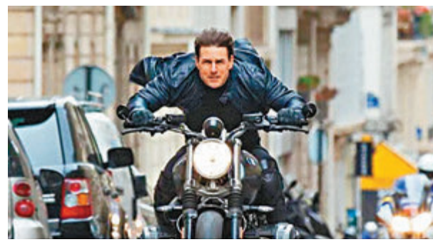
●《職業特工隊7》的拍攝一波三折。

派拉蒙影業公司(Paramount Pictures)昨日發表聲明：「由於在例行採檢中發現冠狀病毒陽性結果，我們暫時中止《職業特工隊7》攝製作業