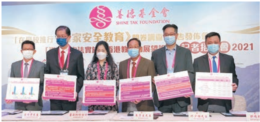
●善德基金會早前發出問卷調查，有近九成學校認同要加強國安教育。

教育局近日公布中國歷史、歷史、生活與社會、經濟等科目的國安教育課程框架，令有提供國安元素指引的科目增至15個。香港善德基金會於4月底至5月中進行了「在學校推行國家安全教育問卷調查」，以了解學校的取態及需求，共收回218間中小幼學校的管理層及教師回覆，涵蓋77間中學、80間小學及61間幼稚園。