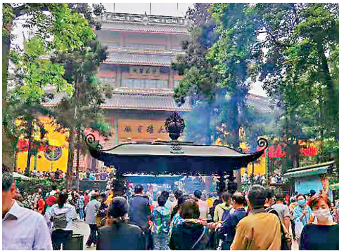
●千年古刹靈隱寺，歷來香火極盛。

「靈隱」二字，自帶禪意。「飛來」和「冷泉」，也讓人遐想不已。而最令我印象深刻的，是居中而建的藥師殿。雖然很多寺廟都供奉藥師佛，但如此雄偉的藥師殿卻是平生所僅見。它以物化的載體，傳達質樸的理念：療傷和治病，是每個人終其一生的必修課，身心皆然。在飛來峰一線天絕壁上，有元代摩崖石刻。當我從中看到「息羽聽經」四個蒼勁圓潤