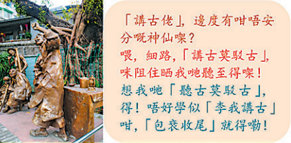
「講古佬」，邊度有咁唔安分呢神仙嘍？