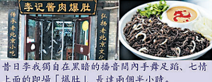
昔日李我獨自在黑暗的播音間內手舞足蹈、七情上面的即場「爆肚」，長達兩個半小時。