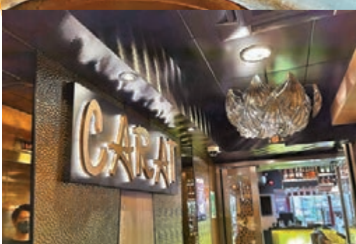
●印度地中海餐廳入口