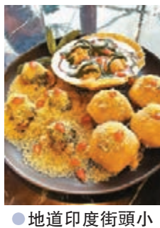
●地道印度街頭小食新德里懷舊三式小食拼盤