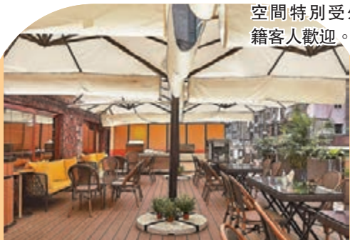
●餐廳的戶外空間特別受外籍客人歡迎。