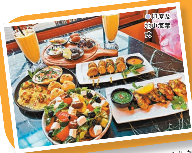
●印度及地中海菜式