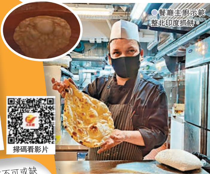
●餐廳主廚示範整北印度抓餅。