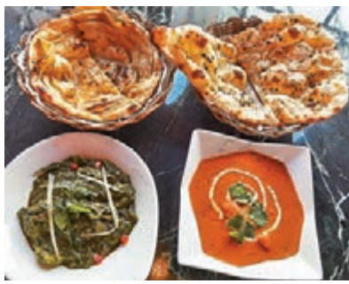
●小茴香籽烤餅(左)及乾番茄辣椒烤餅(右)