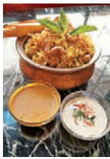
●乳酪番紅花薄荷羊肉香飯