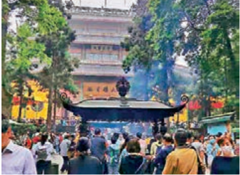
千年古剎靈隱寺，歷來香火極盛。

「靈隱」二字，自帶禪意。「飛來」和「冷泉」，也讓人遐想不已。而最令我印象深刻的，是居中而建的藥師殿。雖然很多寺廟都供奉藥師佛，但如此雄偉的藥師殿卻是平生所僅見。