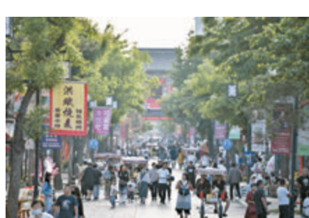
▲遊客在灤州古城內遊覽