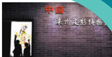
▲小朋友在灤州古城內的中國灤州皮影博物館參觀

在中國評劇藝術館及體驗中心裏，由評劇展陳區、評劇體驗區、評劇演出劇場、接待廳、排練廳、評劇戲曲文創產品售賣專區、評劇主題賓館等組成，館內展出了上萬件具有收藏價值的劇本、戲單、劇裝、劇照、唱片、磁帶、錄像帶、道具、書畫等展品，並運用高科技技術將評劇優秀劇目再現。