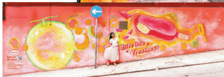
▼中環威靈頓街162號的哈密瓜脆皮雪糕批壁畫