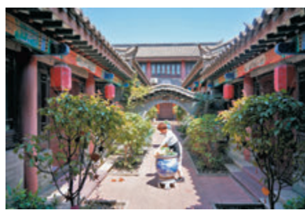
▲灤州古城內一家民宿

這座位於唐山市灤州市古城街道的灤州古城，是三千年大之畔的盛世古城，以研山為骨，以灤水為魂，以人文為韻，以綠林為脈，開發灤州古城並將其打造成國家4A級景區，將26個民族獨特風情織入古老的明清建築，將千年北方文化融匯進這座夢想樂園。這2000畝盛世古城傾情築在北方古街博覽區、傳統民俗旅遊區、灤河文化風景區、北方文化傳承區及北方婚慶體驗區等，締造美麗北方人文古城。