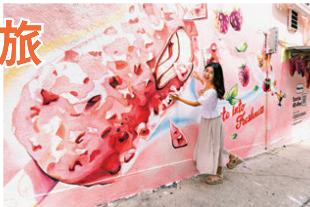
▲中環太平山西街39號的紅桑子脆皮雪糕批壁畫