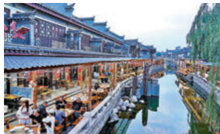
▲民族風情特色酒吧、茶吧、陶吧、咖啡館遍布青龍河兩岸