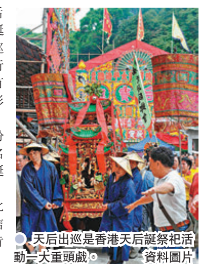
天后出巡是香港天后誕祭活動一大重頭戲。 資料圖片

天后誕於2017年已列入首份香港非物質文化遺產代表作名錄，周樹佳強調，香港天后誕賀誕活動規模盛大兼具特色，因此被列入國家級非物質文化遺產名錄，而這對香港天后信仰文化的傳承有正面作用，肯定會增加對新一代的吸引力。