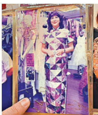
有外國人會特意來港拜訪文師傅訂製旗袍。 香港文匯報記者攝

據悉，截至目前，國家級非遺代表性項目共1,557項，包括民間文學類167項，傳統音樂類189項，傳統舞蹈類144項，傳統戲劇類171項，曲藝類145項，傳統體育、遊藝與雜技類109項，傳統美術類139項，傳統技藝類287項，傳統醫藥類23項，民俗類183項。涉及3,610個申