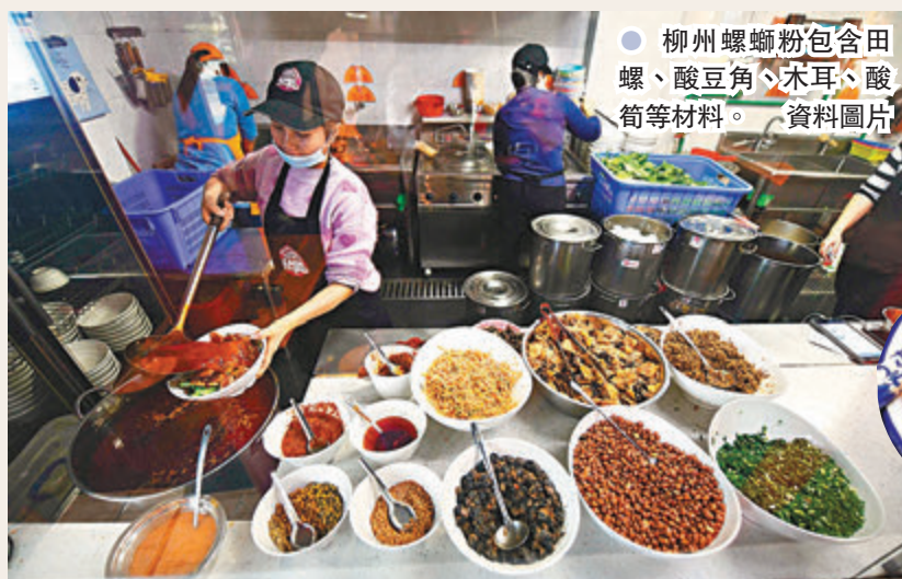
柳州螺螄粉包含田螺、酸豆角、木耳、酸筍等材料。 資料圖片

此外，今年3月，螺霸王洛維產業園正式建成投產，開闢建設了1,200多平方米的螺霸王文化展覽館，實現安全生產、旅遊觀摩兩不誤；今年「五一」期間，內地首個5G XR大型線下主體樂園——柳州螺螄園正式對外營業；集觀光、研學、體驗於一體的螺螄粉小鎮成為國家4A級景區……螺螄粉文化旅遊已成為柳州市工業旅遊的熱點。