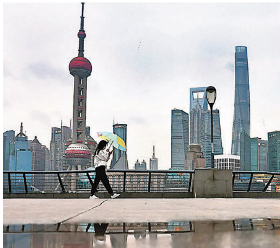
●有專家認為，當前實體經濟表內投資融資活躍，貨幣派生能力較強，目前貨幣信託環境仍有助於為經濟恢復提供支持。新華社

中信建投指出，社融存量增速從2020年末的13.3%逐步回落至10%-11%區間，3月回落了1個百分點，4月回落0.6個百分點，5月再降0.7個百分點，預計後期回落幅度將逐月放緩，全年社融新增量約30萬億元。M2增速逐步從2020年末的10.1%回落至8.5%左右，下半年增速或震盪中小幅回升。