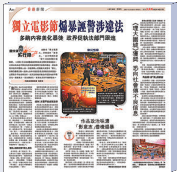
●香港文匯報今年1月23日A10版(上圖)及3月11日A17版(下圖)，揭露「影意志」煽暴播「獨」惡行。

國家安全罪行，或可能導致嚴重破壞公共秩序的暴力行為，並相當可能鼓勵或煽動觀眾作類似行為，有關描繪不得在影片中出現。檢查員應考慮描繪的細緻程度、篇幅、影片鋪排、是否包含任何偏頗的手法表達等，及應考慮影片上映會否削弱觀眾的國家安全意識或對遵守法紀的重視，或扭曲他們對何謂合法的觀念，因而導致或鼓勵觀眾以身試法。 更審慎檢查「紀錄片」「真實事件」 針對有影片聲稱為紀錄片，或聲稱是重演香港的真實事件，由於本地觀眾可能對影片的內容有較強烈的感受、衝擊，檢查員須更加審慎，仔細檢查影片是否包含任何偏頗、未經核實、虛假或具誤導性的敘述或評論，及該等內容有多大可能導致觀眾模仿影片所描繪的犯罪行為。 新指引還訂明若影片名稱、影片的宣传資料或包裝物，意圖認同、支持、宣揚、美化、鼓勵或煽動任何犯罪行為或任何可能危害國家安全的行為，均可能被拒絕。 商經局昨日在聲明中表示，根據香港國安法第三條，特區行政、立法和司法機關應當依據該法和其他有關法律規定，有效防範、制止和懲治危害國家安全的行為和活動。因此，電影檢查員在履行條例下的職務時須遵守上述條文。