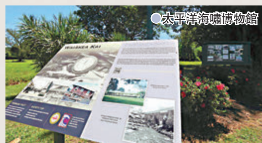
●太平洋海嘯博物館

國家博物館館長鍾梅坤表示，在疫情期間，博物館致力發展相關科技，讓館方更能了解公眾的需要，這種數碼與現實生活結合的展覽方式，將成為疫情過後的博物館發展趨勢。