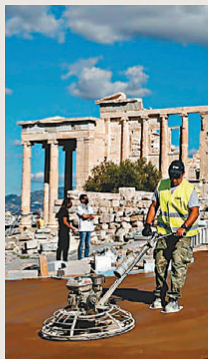
●衛城建造可供輪椅人士使用的通道。

希臘文化部諮詢殘疾人士協會後，決定進行改善工程，例如增設供失明人士的凸字標示，同時加設扶手和斜坡警告牌，並建造一條可供坐輪椅人士使用通往衛城的通道。新通道已於今年3月開放，取代從1970年代遺留下來、多處出現侵蝕的通道，新通道下鋪上人造膜，可覆蓋古舊石塊免受損毀。文化部長門多尼表示，坐輪椅人士對於可使用新通道感到高興，她形容讓遊客有更好的體驗，與保護文物同樣重要。