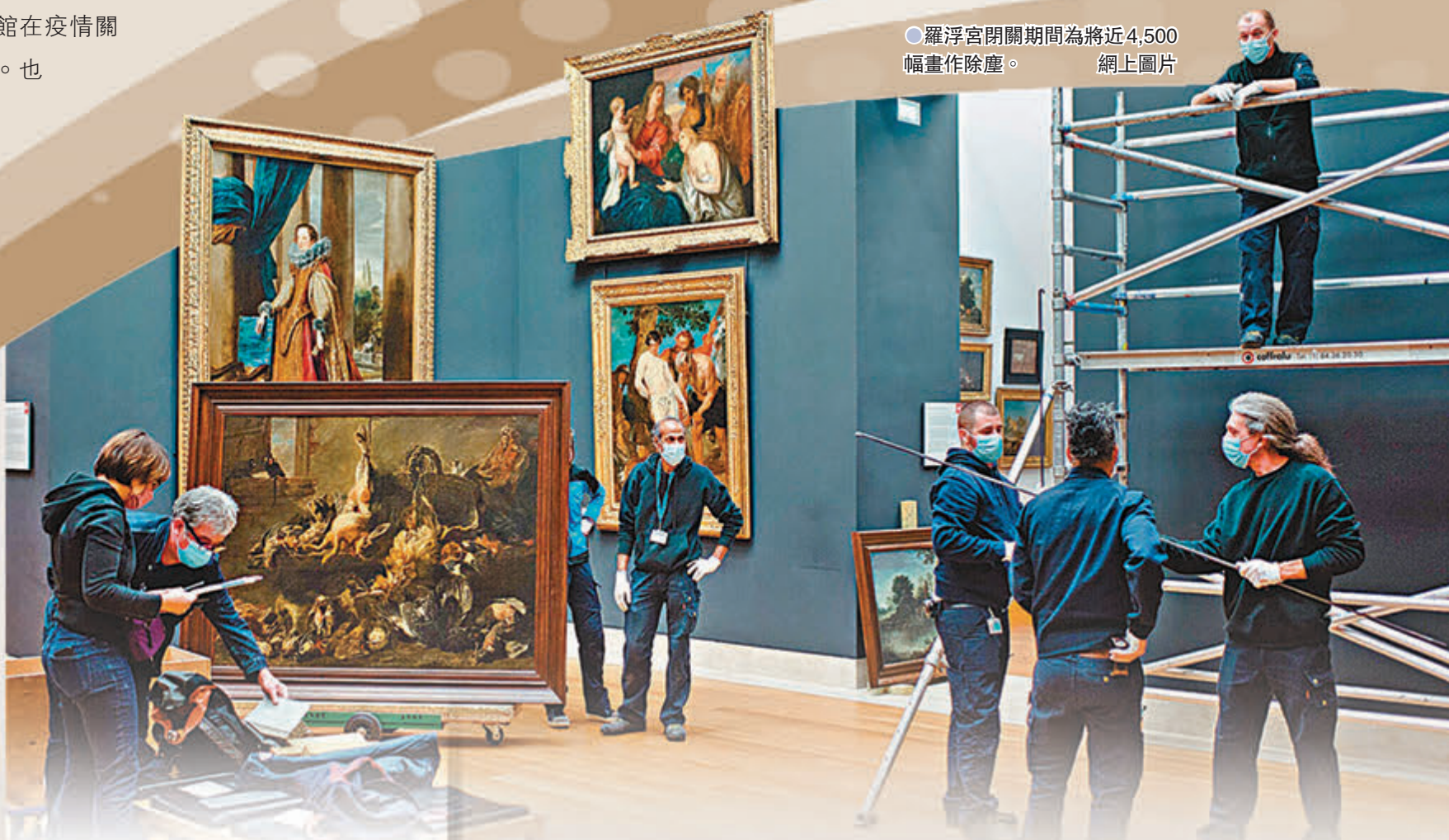
●羅浮宮閉關期間為將近4,500幅畫作除塵。