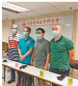
●鐵路工會要求設按年資加薪的制度。

他指，過去一年凍薪，員工士氣低落，特別是疫情期間同事均堅守崗位，要求港鐵繼續發放特別獎金，鼓勵士氣。另外，公司亦應改善現有醫療福利及津貼，提升醫療保障範圍。