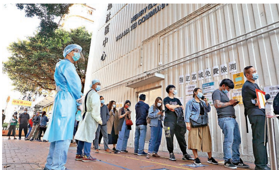
▲全港有21間社區檢測中心，當中3間檢測中心將陸續停運。圖為梁顯利油麻地社區中心。資料圖片

昨日新增的3名確診者都是印傭，她們於6月11日乘搭國泰航空CX798航班由印尼雅加達抵港，其中32歲及39歲的印傭為同行人士，兩人被驗出帶有L452R變種病毒株。由於該航班有3名乘客抵港後確診，衛生署根據「熔断機制」，昨日起禁國泰航空客機從雅加達達陸本港，為期14天。