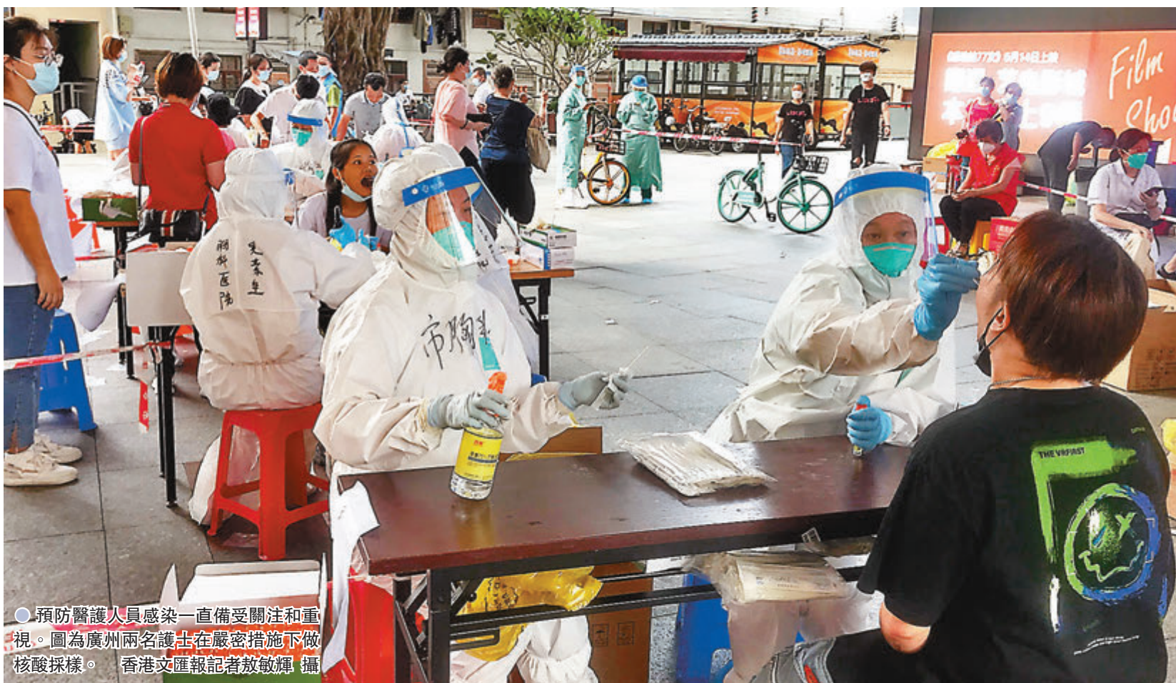
預防醫護人員感染一直備受關注和重視。圖為廣州兩名護士在嚴密措施下做核酸採樣。