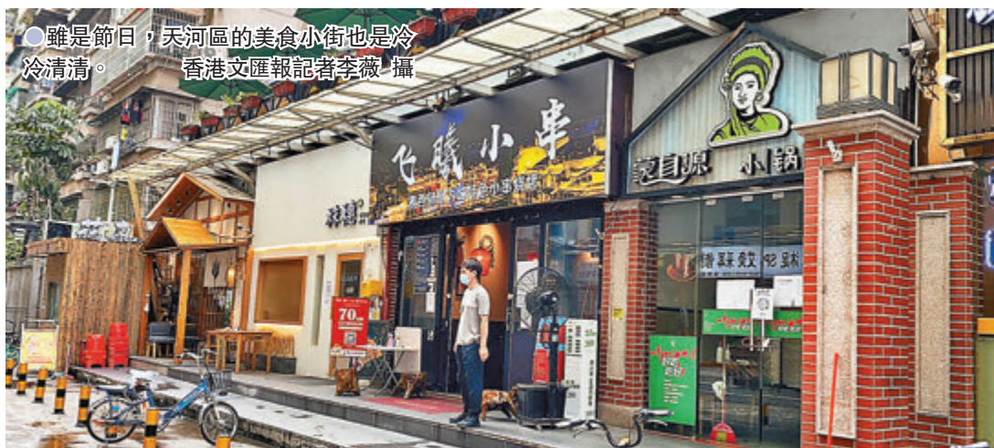
雖是節日，天河區的美食小街也是冷冷清清。

何女士在廣州天河區經營的東南亞餐廳，疫情之前每天進店用餐的客人在150人左右，如今堂食開放受限，工作日最多也僅20人前來用餐。在端午節前一日，何女士的店裏久違地迎來八桌客人同時用餐。當時正在門口把守測溫掃碼的她，轉身看到這個畫面，眼淚都流出來了。「其實現在開源節流也並沒有實質作用」。何女士告訴香港文匯報記者，即便有客人，店裏每天收支賬戶仍要虧損5,000元(人民幣，下同)以上。雖然現在正處於端午小長假，何女士還是決