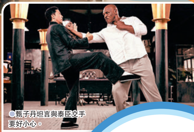
甄子丹坦言與泰臣交手要「小心」。