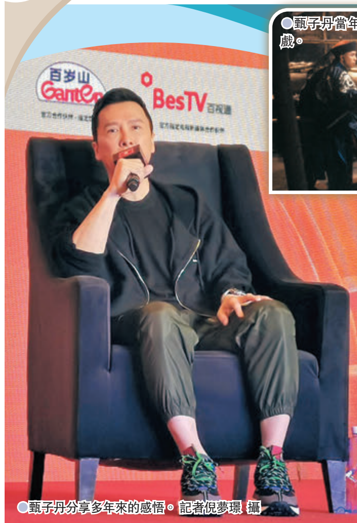
甄子丹分享多年來的感悟。