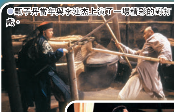
甄子丹當年與李連杰上演了一場精彩的對打戲。