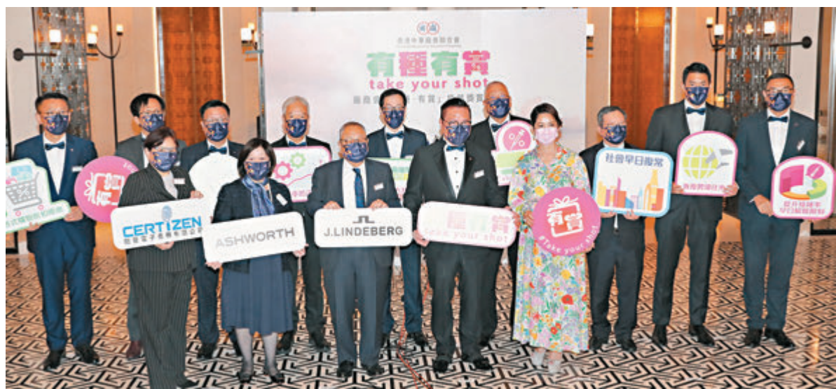
●廠商會表示，獎賞計劃分為專屬購物優惠和大抽獎兩部分。

廠商會昨日宣布，目前有近30間零售和服務企業、逾百間店舖和食肆參與商會的購物優惠計劃。今日(18日)起出示疫苗接種記錄的市民，到有關商戶即享多種優惠。