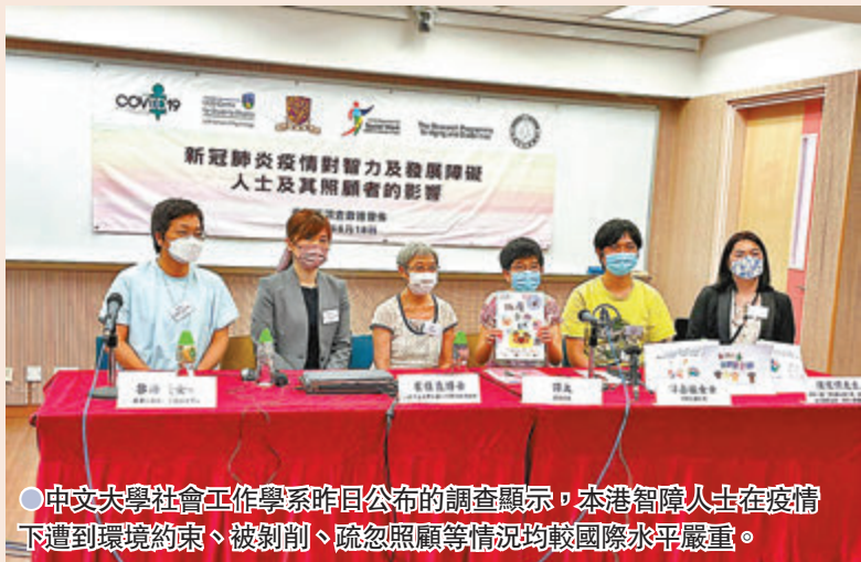
●中大社會工作學系昨日公布的調查顯示,本港智障人士在疫下遭到環境約束、被剝削、疏忽照顧等情況均較國際水平嚴重。