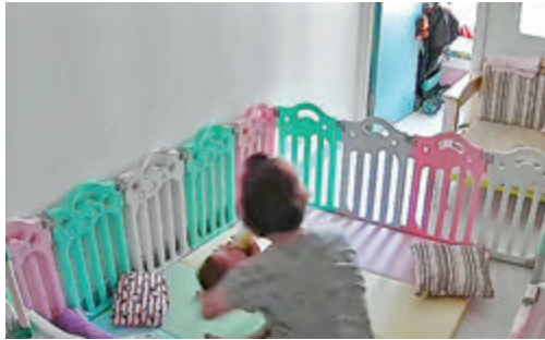
●保姆起初抱着女嬰餵奶(左圖)，其後女嬰大哭(中圖)，保姆粗暴將女嬰摔落地席(右圖)。