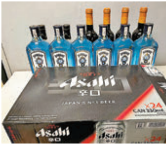
▲警方檢獲大批酒類等證物

香港文匯報訊(記者 蕭景源)警方由前晚至昨日清晨，展開代號「雷霆2021」、「犁庭掃穴」及「虎撲」行動，打擊三合會罪行及夜場「犯聚」活動，出動逾千警力於全港6個總區內搜查多個目標娛樂場所、酒吧、桑拿、麻將館、遊戲機中心及住宅單位等，警務處副處長(行動)蕭澤頤親自督師。行動中，警方搗破多個非法賭檔、無牌酒吧及違規經營派對房間等，至昨晨共拘捕逾200人，包括通緝犯、開賭聚賭、違反「限業令」處所負責人及違反「限聚令」顧客等，亦揭發有13歲學生光顧無牌吧。