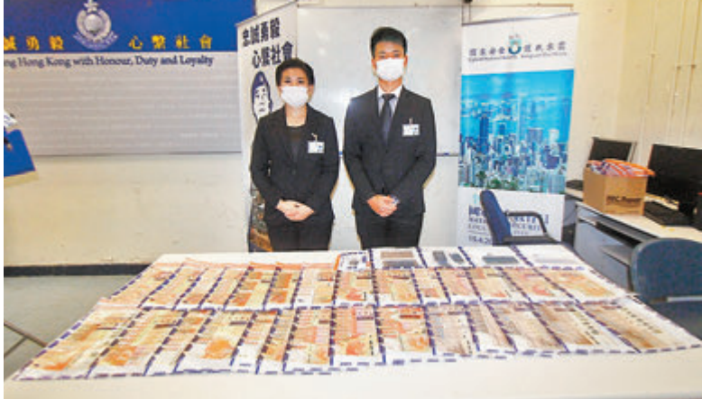
●警方起回47萬元現金贓款。