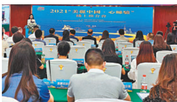
▲2021「美麗中國·心睇驗」線上推介會重慶開幕

安徽省文化和旅游廳的推介圍繞「美好安徽·歡樂皖江」主題，以三大名山（黃山、九華山、天柱山）、三大水系（長江、淮河、新安江）、三大文化（老莊文化、桐城文化、徽文化）為脈絡，展現出生態良好、物產豐饒、文化燦爛、新奇時尚的八百里皖江城市風采。