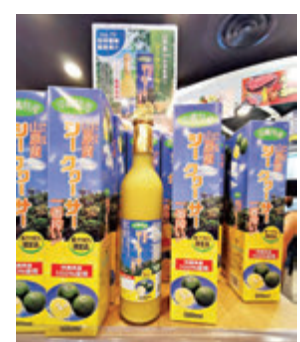
▲鮮榨100%沖繩香檸檬切濃縮果汁。