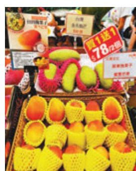
▲台灣地區直送的各款芒果。