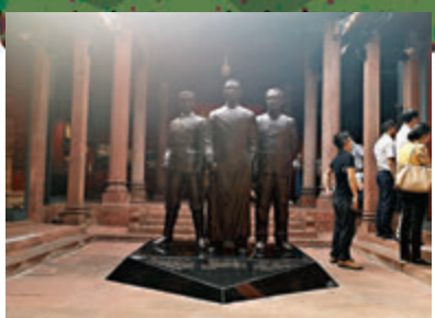
●展館內的革命先烈雕像