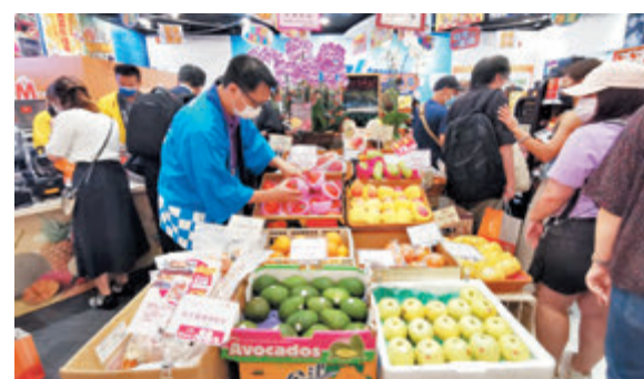
▲首間實體店內擺滿來自世界各地的環球直送商品，琳琅滿目。