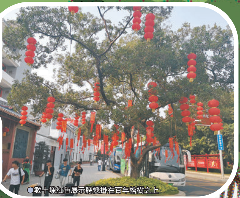
●數十塊紅色展示牌懸掛在百年榕樹之上