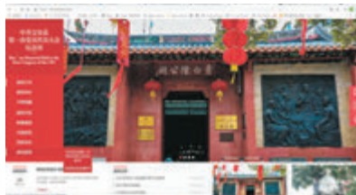
●「中共寶安縣第一次黨員代表大會紀念館」網址

這一舉措在疫情期間發揮了重要作用，「線上探訪展館的形式太方便了！3D旋轉的展示方式配合文字資料，比在展覽現場看得還要清晰。」一位網友這樣留言。