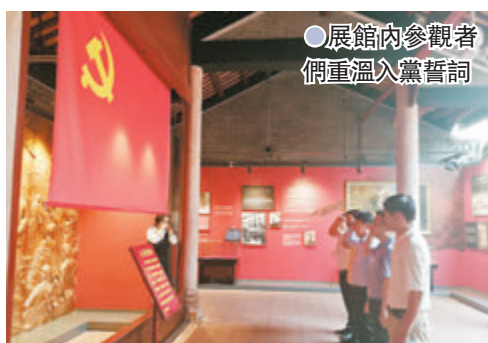
●展館內參觀者們重溫入党誓词