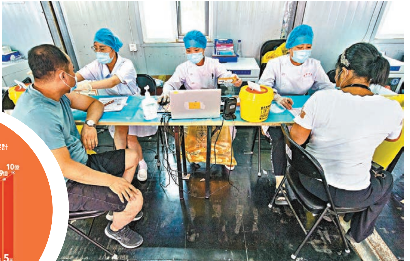
●6月16日,北京市和天津市18歲及以上人群新冠疫苗全程接種率也已突破80%。圖為20日,市民在北京市朝陽區望京地區的一處疫苗接種點接種新冠疫苗。