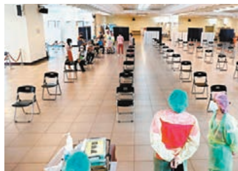
●18日,新北市一處接種站,醫療人員等待為長者施打疫苗。

近日台灣新冠肺炎確診和死亡人數有下降趨勢,輿論關注何時解除三級疫情警戒,指揮中心對此表示,仍希望全台灣一致而非分縣市解封,不傾向一下子從三級退回第二級,但會考慮調整低風險場域防疫規範強度。