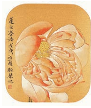
●書畫作品《工筆荷花》