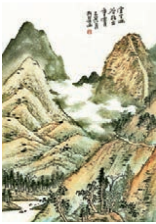
●書畫作品《山水斗方》