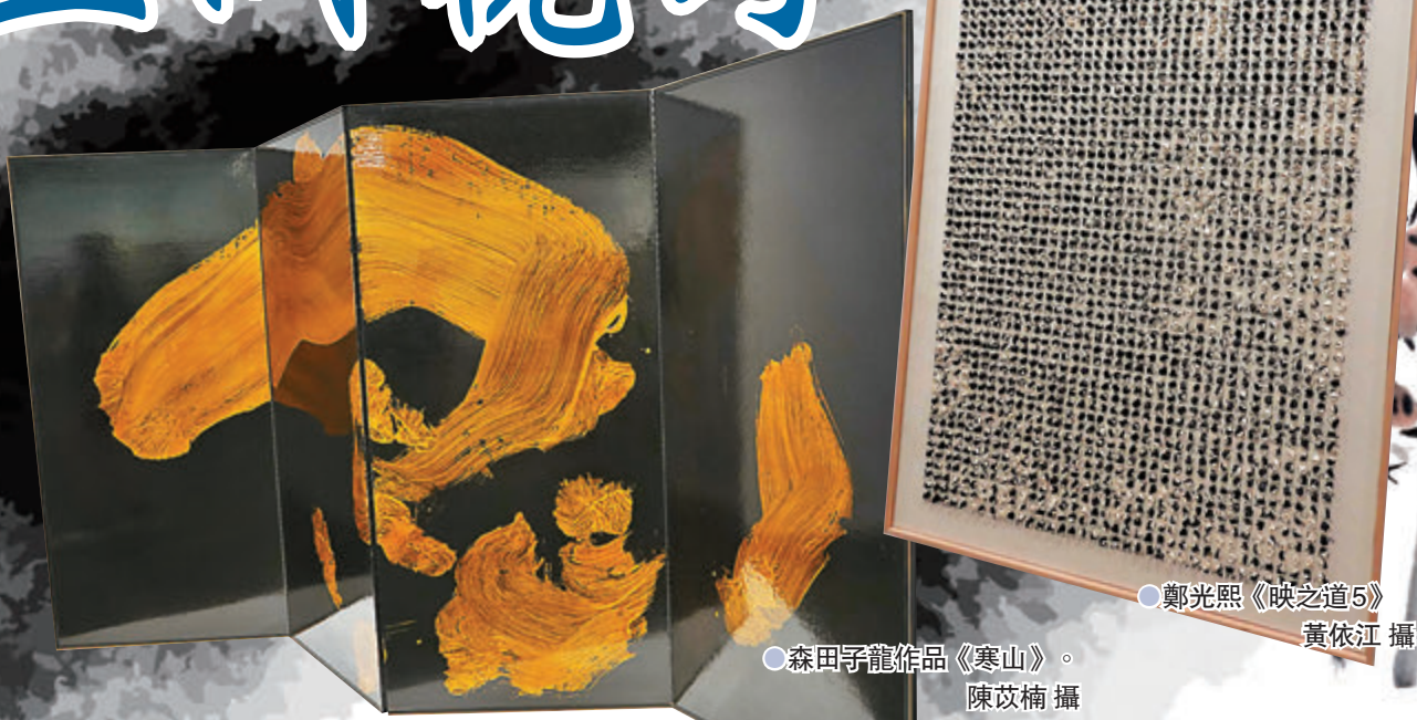
●森田子龍作品《寒山》。