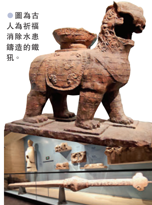
●圖為長7.5米、重達1500多公斤的清康熙年間鑄水鐵劍。