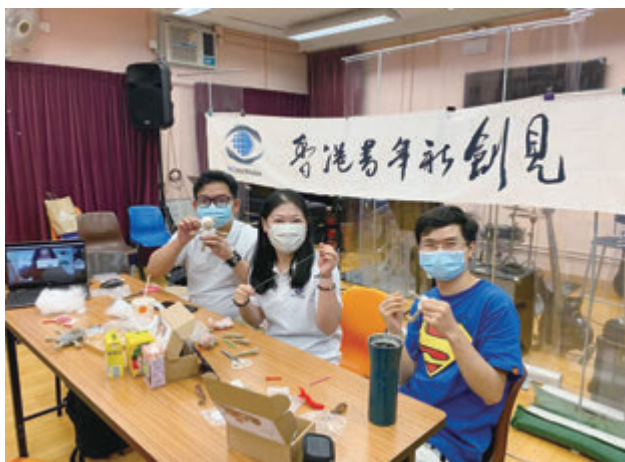
●學員與其子女一起學習中華文化——茶百戲。

香港青年新創見於6月19日成功舉辦以父親節為主題的中國傳統非遺工藝——麻編班。此次課程邀請了國家級麻編技藝代表性傳承人於線上授課，分享麻編文化及與100位學員於線上實時製