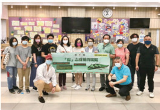
●「粽」志成城賀端陽義工活動合照。

為秉承創辦同鄉會的宗旨和精神，積極推展關心社區和服務社群工作，佛山五個團體——香港佛山祖廟海外聯誼會、香港南莊同鄉會、香港三水樂平同鄉會、香港三水白坭同鄉會和香港順德