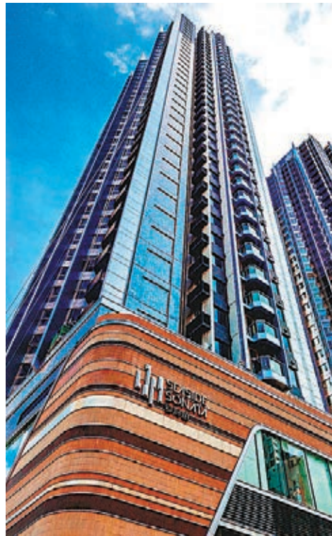
●愛海頌料於短期內取得入伙紙，最新價單已削減部分剩餘單位折扣優惠。資料圖片

新盤銷情持續向好，中國海外旗下啟德維港1號開價前夕，各大發展商紛紛推售貨尾盤搶客，本周六有三個貨尾盤合共推售208伙，部分更削減優惠。長實旗下快取得入伙紙的長沙灣愛海頌以先到先得形式發售項目最後103伙，折實價927.3萬元起，並已削減部分剩餘單位的折扣優惠。新世界旗下大圍站柏傲莊I及II亦盡推95伙餘貨。