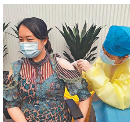
●深圳市民在接種新冠肺炎疫苗。

常巨平表示,疫情發生以來,深圳集中優質資源全力以赴做好醫療救治,具有抗擊經驗的感染科、重症免疫科、中醫科、呼吸科、心理科等專業專家組成的高水平醫療團隊,制定精準的治療方案,強化「一人一案一策」個體化診療