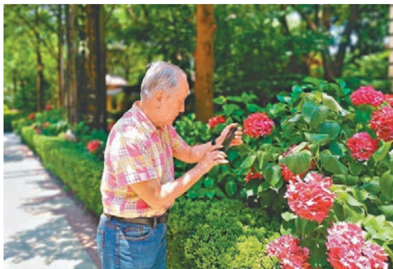
●郁慕明已經結束了在上海的隔離,可以到處走走。

令很多人意想不到的,現時的郁慕明已經是一個「網紅」。在與香港文匯報記者聯繫時,他多次推薦自己在抖音和今日頭條上的社交賬號,並表示一直在更新。其中「郁慕明都言不止」賬號粉絲已過253萬,抖音的實名賬號粉絲也超過了44萬。而他