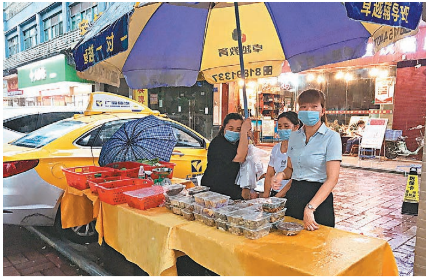
●有餐飲店在路邊擺攤賣菜,但客人極少。

事實上,餐飲行業在次輪疫情中的影響幾乎是最大的。廣東省餐飲服務行業協會問卷調查顯示,廣州近9成的受訪企業營收同比下降50%以上,近5成企業營收同比下降80%以上,超過9成企業反映員工薪酬發放成為當前餐飲業最大的困難,難以承受門店租金壓力的企業佔比達到85%以上。