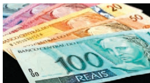
●新興市場貨幣近期表現強勁，巴西雷亞爾兌美元今年三月以來已升一成。資料圖片