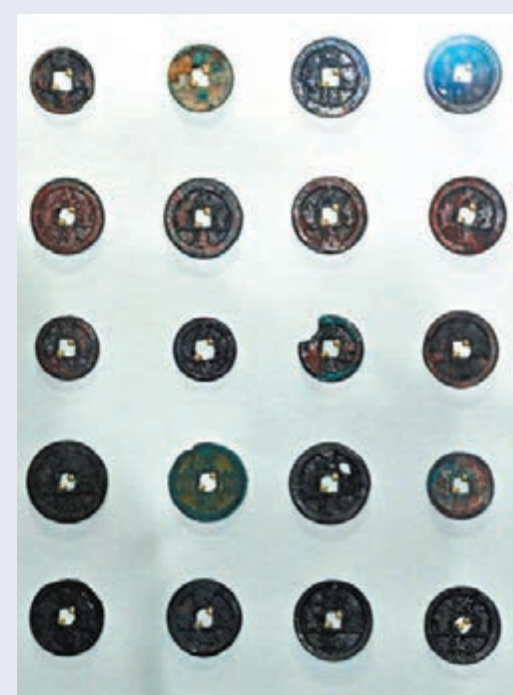
▲站內展出的宋代銅錢。