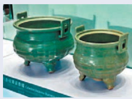
▲八卦紋青瓷香爐，保存較完整。