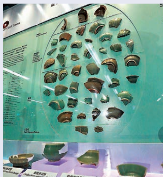
▲站內展出的龍泉青瓷器，上有蓮瓣紋、劃花和貼雙魚紋等紋飾裝飾。