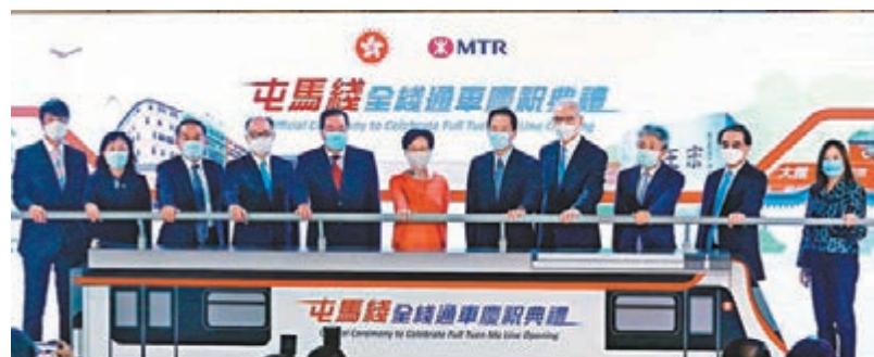
●林鄭月娥(左六)主持屯馬綫通車儀式。