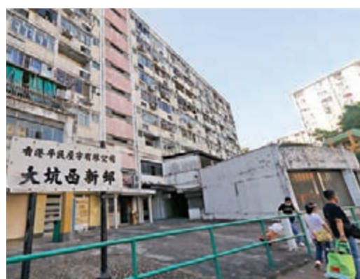
●大坑西新邨重建計劃早前公布，市建局只需要負責涉款約100億元的建築費。資料圖片

針對市建局早前公布提供3,300個單位的大坑西新邨重建計劃詳情，其中2,000個將為首置單