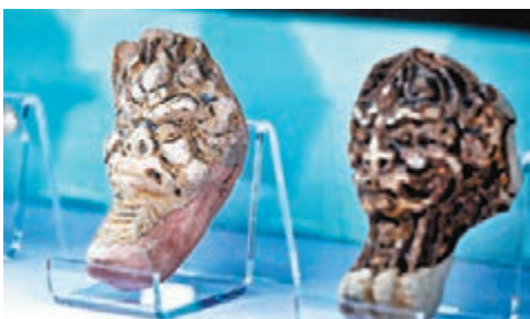
●香爐獸足。

港鐵行政總裁金澤培表示，作為首個車站文物館，新站啟用初期預計吸引較多市民到站觀賞文物，港鐵公司將增派人手維持秩序，並強調展覽長期舉行，呼籲市民不必急於一時。至於宋皇臺站C出口，因涉及文物古蹟原址保育，需在完善設計後才會建造。