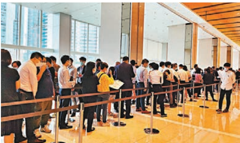
●維港1號首個周末吸引大批市民到九龍灣國際交易中心售樓處參觀示範單位。

趁維港1號收票之際，九龍區多個貨尾盤爭相推售，其中長實與市建局合作的長沙灣愛海頌昨日推售最後103伙，包括25伙兩房戶及78伙三房戶，折實入場費927.3萬元，消息指售出16伙。恒基地產旗下旺角利奧坊·熾岸亦推售10伙，一房及兩房各佔一半，折實入場630.99萬元，消息指售出1伙。