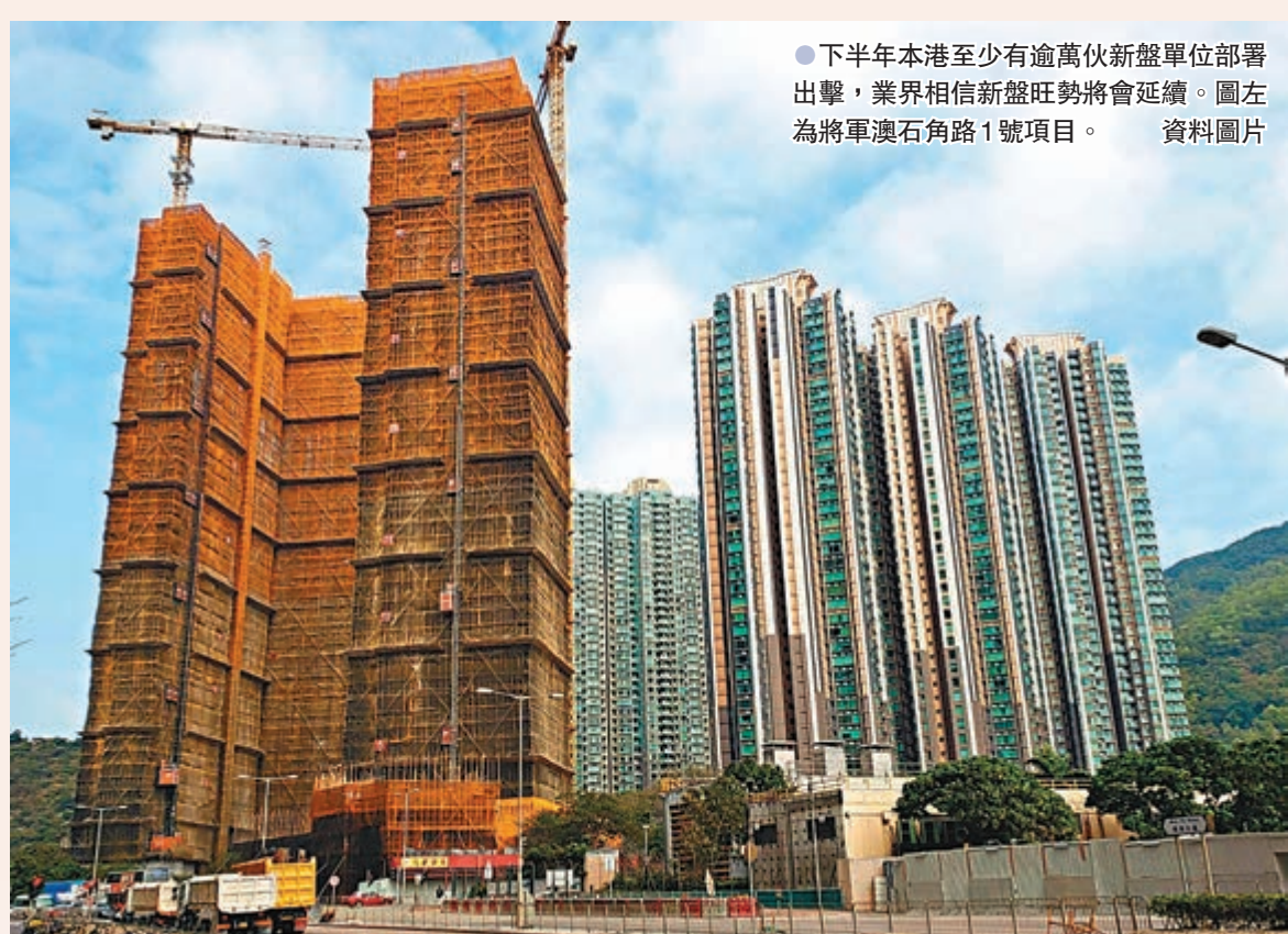
●下半年本港至少有逾萬伙新盤單位部署出擊，業界相信新盤旺勢將會延續。圖左為將軍澳石角路1號項目。資料圖片