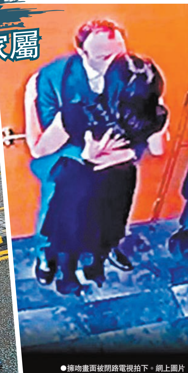
●擁吻畫面被閉路電視拍下。網上圖片