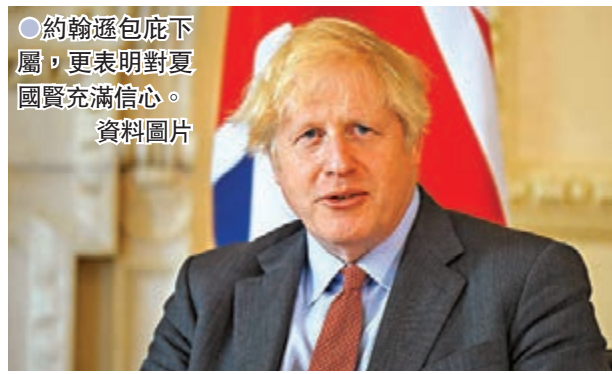
●約翰遜包庇下屬,更表明對夏國賢充滿信心。資料圖片

美國政府後來重啟對不明飛行物的調查,自2007年起秘密資助一個小型項目,用於調查軍方人員報告的「不明空中現象」,這個項目在2017年經《紐約時報》報道後,外界才首次得悉。美國國防部去年重新推進這項目,改名為「不明空中現象工作小組」,任務為偵測、分析和分類有關不明飛行物的報告,並鼓勵軍方人員擺脫外界對相關目擊者的負面印象,敢於向上級報告事件,令當局能更好地掌握情報。民主黨眾議員卡森認為,人們一向只是將「不明空中現象」視為科幻小說元素,令目擊者因外界眼光而不願貿然公開談論。 ●綜合報道