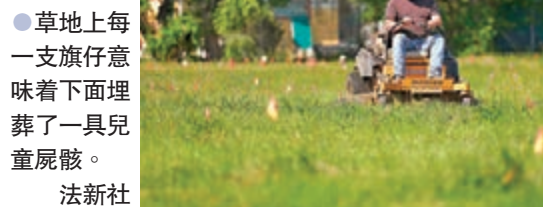
●草地上每一支旗仔意味着下面埋葬了一具兒童屍骸。

身為天主教徒的杜魯多還表示,他已與方濟各直接對話,強調教宗致歉非常重要,「不僅如此,教宗也要來到加拿大土地上,向原住民道歉。」加拿大一間原住民學校舊址本月初發現215具兒童遺骸後,方濟各曾就事件表示感到痛苦,呼籲尊重原住民文化和權益,不過並未就事件致歉。 ●綜合報道