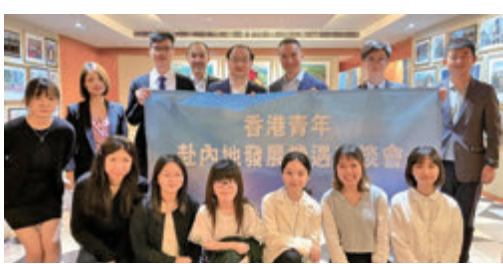
●香港青年赴內地發展機遇座談會舉行。

為增強香港青年對國家發展的認識，觀瀾湖集團日前首次與香港中文大學逸夫書院合作，特別為學生舉辦「香港青年赴內地發展機遇座談會」，學生透過與嘉賓面對面的交流，加深對內地創業和就業的機遇，以及相關惠民政策，未來投身職場作更好的準備。