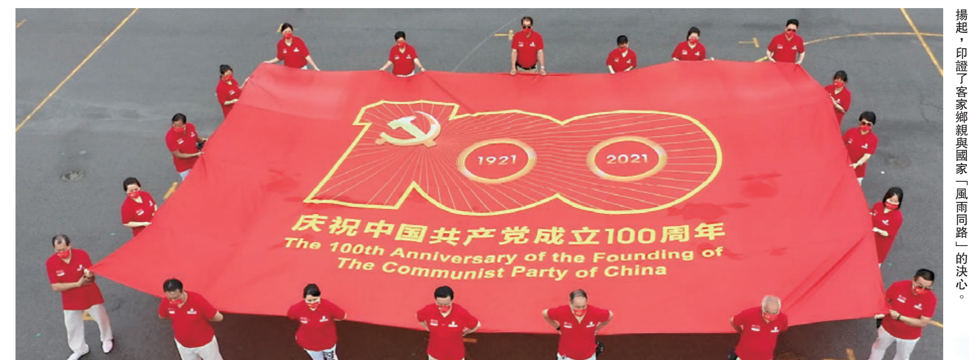
▲印有「慶祝中國共產黨成立100周年」標誌的超大型旗幟在雨中揚起，印證了客家鄉親與國家「風雨同舟」的決心。