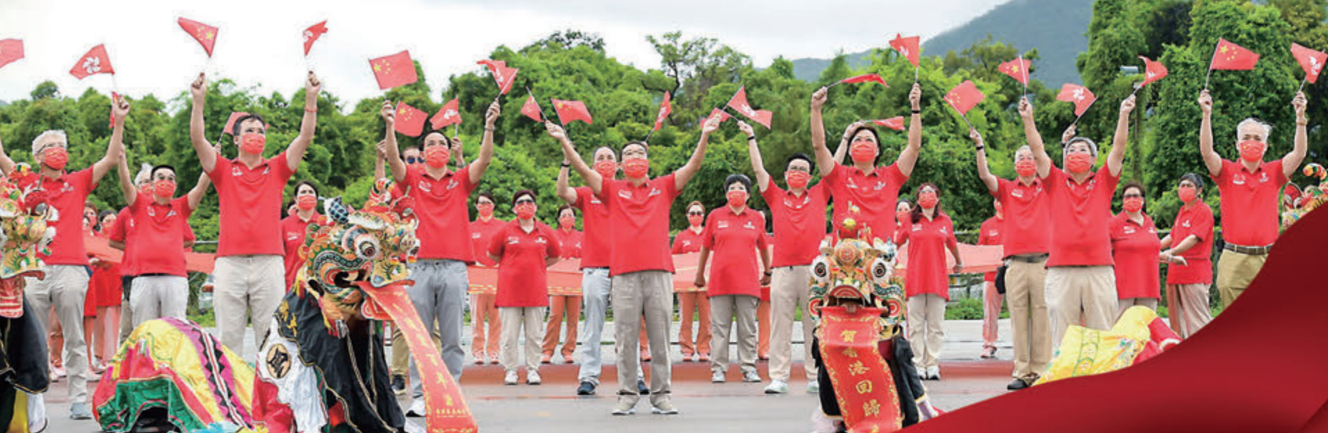
▲客屬總會會長帶領該會新界分會會員於林村許願廣場進行拍攝，齊心協力賀建黨100周年。