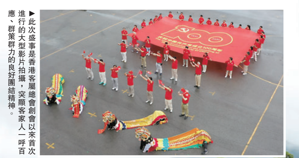
▲此次盛事是香港客屬總會創會以來首次進行的超大型影片拍攝，突顯客家人一呼百應、群策群力的良好團結精神。