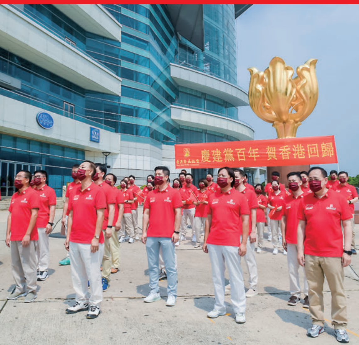
▲香港客屬總會主席團於金紫荊廣場齊聲合唱《沒有共產黨就沒有新中國》《獅子山下》。