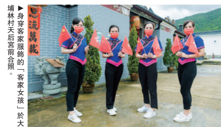
▲身穿客家服飾的「客家女孩」於大埔林村天后宮前合照。