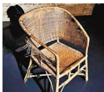
焦裕祿曾經坐過的藤椅。

1964年5月14日，焦裕祿被肝癌奪去了生命，年僅42歲。他臨終前對組織上唯一的要求，就是「把我運回蘭考，埋在沙堆上。活着我沒有治好沙丘，死了也要看着你們把沙丘治好」。1966年，河南省人民政府追認焦裕祿同志為革命烈士。「焦書記最後真的把自己的命給了蘭考大地。」魏善民動情地說。