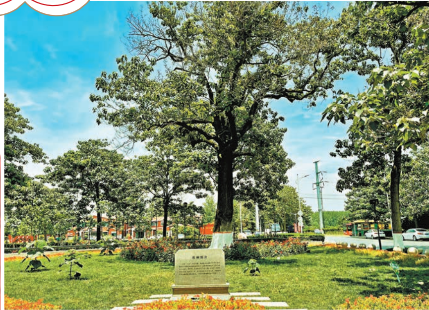
在焦裕祿幹部學院門口的「焦桐」。