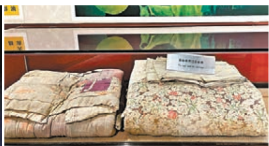
焦裕祿用過的被褥。

特稿 樸素的土氣就是革命的正氣 在焦裕祿紀念館，香港文匯報記者看到按照原來的樣子復原的焦裕祿辦公室，只見一件藤椅一個破了個大洞。工作人員告訴香港文匯報記者，焦書記有肝病，發明了多種多樣對抗病魔的方法，人們可以看到不論是開會還是做報告，都把右腳踩在椅子上頂着肝部。在辦公室就用鋼筆或者雞毛筆一頭頂着肝部一頭頂着椅子，久而久之，椅子上就被頂出了一個大洞。 「焦書記一幹工作心中就沒有一點自己。我多希望他能稍微考慮一下自己，能給自己看看病。」魏善民告訴香港文匯報記者，「他光說讓群眾想法到醫院看病，可是他自己卻一直不去。」 用過的被褥上都是補丁 焦裕祿的樸素還體現在他的穿着上。紀念館展出的焦裕祿曾經用過的被子褥子，上面都是補丁。「他用過的一條被子上有42個補丁，褥子上有36個補丁。他穿過的鞋，裏面的視布全部磨光了，鞋面破了12個窟窿。」工作人員動情地介紹道，焦書記愛人要給他買雙新襪子，焦書記說：「跟貧下中農比一比，咱穿的就不錯了。目前，國家正處在困難時期，咱也得為國分憂，過幾年緊日子。樸素的土氣，就是革命的正氣呀！」 魏善民說，現在咱們生活不知道比過去好多少了，但是也不能忘記焦書記這句話。「不能鋪張浪費，更不能處處嚷嚷自己家多好過。踏踏實實過好自己的日子，比啥都硬氣。」魏善民說，等他幹不動了，他就讓三兒子接替他，繼續守護好「焦桐」。