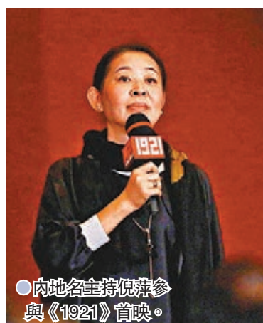
內地名主持倪萍參與《1921》首映。

據報，6月28日電影首映，現場還來了很多業內的導演和演員，導演王紅衛、唐季禮、張一白、烏爾善、郭子健及近段時間廣受好評的主旋律劇集《叛逆者》的導演周游等，知名主持人倪萍，演員董子健、李治廷，編劇張冀、秦海燕、趙寧宇、袁媛、任鵬等都來到了現場。這些影視界同業都對影片不吝稱讚之詞。香港導演唐季禮表示：「這是一部我看了感到很激動、很細膩的故事片，但同時它也含有類型化元素，諜戰那條線讓我感到驚險刺激，看得很過癮。希望中國更多的青年通過觀影更加愛國。」