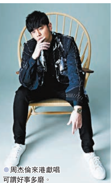
周杰倫來港獻唱可謂好事多磨。