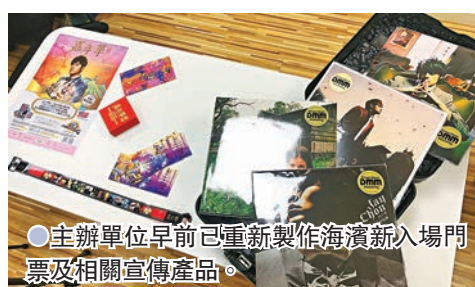
主辦單位早前已重新製作海濱新入場門票及相關宣傳產品。

此外，主辦單位又表示準備創建一個世界紀錄：「世界上應該未試過有一個演唱會，超過10萬觀眾，一直持有門票不肯放讓，等待足二年半，我們相信10萬人一同等待兩年半已經是一個世界紀錄，會嘗試入紙健力士申請，看看杰倫是否可以跟歌迷一起拿到健力士世界紀錄作為一個紀念，以答謝大家長期持有門票不放不讓的決心。」已購票者可因應個人情況，決定等明年3月到場觀賞或即時申請退票。