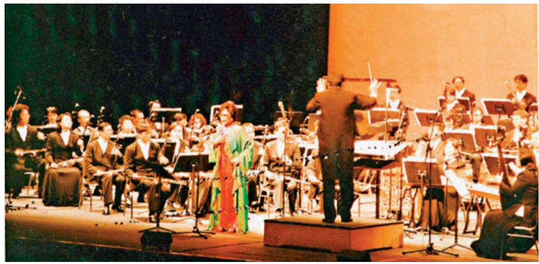
●香港臨時市政局於1998年12月在香港舉辦「紅線女從藝六十年慶賀活動」，圖為紅線女演唱《荔枝頌》。