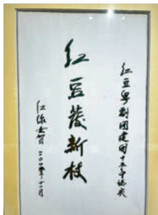
●紅線女為慶祝紅粵劇團建團15周年的題字，寄託了她對「南國紅豆」的厚望。