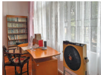
●讀書是紅線女一大愛好，圖為紅線女生前使用過的書櫃和書桌。