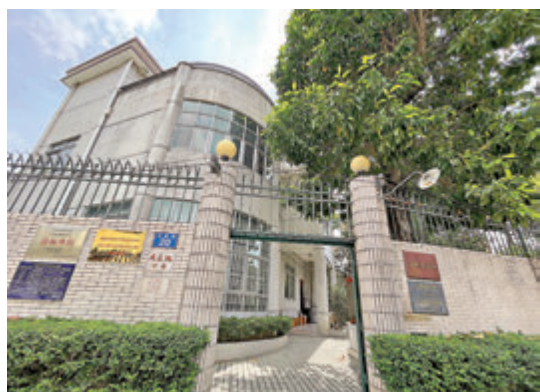
●廣州市華僑新村友愛路20號的紅線女舊居，紅線女於1955年底從香港回到內地，1957年起居於此地。