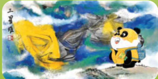
●具天府國際機場、九寨溝及三星堆元素的「旅行熊貓」。