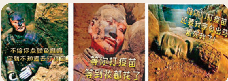
●兵馬俑還衍生出疫苗接種表情包。

有市民在社交媒體留言稱，「你有金色健康碼，額（陝西方言，我）有『黃金兵馬俑』，陝西人果然是最有排面的。」也有網友留言，自從升級了黃金兵馬俑皮膚，都不敢隨便亮出健康碼了，怕閃到大家的眼睛。更有外地的網友表示，「黃金兵馬俑皮膚太牛了，都想去西安打疫苗了。人家『兵馬俑』都來了，咱們也得緊跟潮流。」