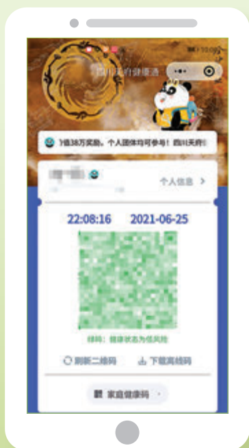
●完成接種後的四川健康碼。