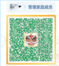
●完成兩針後，綠色「粵康碼」四周鑲金邊，中間有隻紅色獅頭。 手機截圖