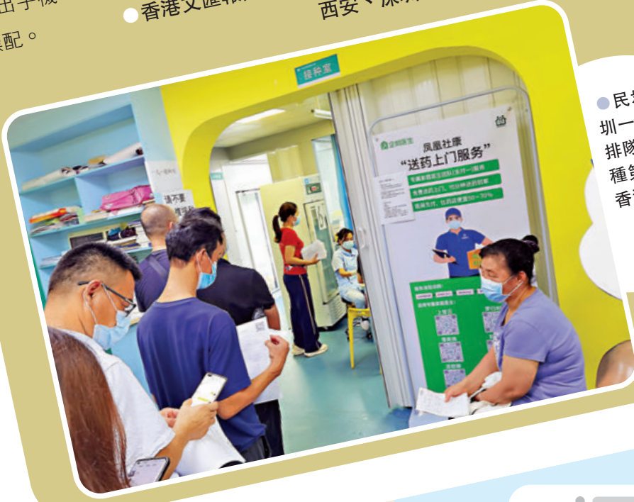
●民眾在深圳一接種點排隊等候接種第二針。

本港有不少企業主導的抽獎活動鼓勵市民打疫苗，在內地，地方政府則在小細節上下功夫，例如「健康碼」小程序上，隨着疫苗注射進度的變化，會出現具有地方特色的各種卡通萌物和背景圖。掏出手機，健康碼上有「萌物」顯示，成為讓民眾驕傲又安心的新標配。 ●香港文匯報記者 李陽波、郭若溪、向芸、譚旻熙 西安、深圳、成都、雲南報道