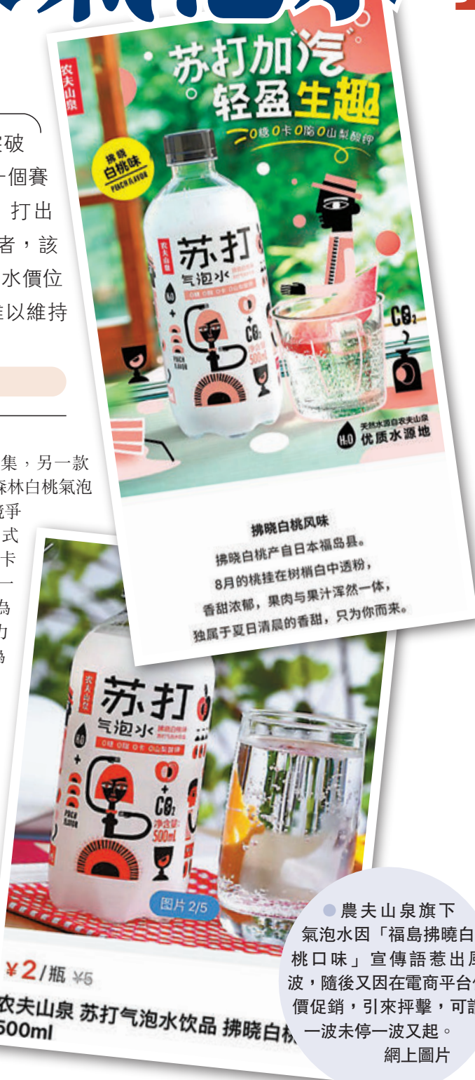
●農夫山泉旗下氣泡水因「福島拂曉白桃口味」宣傳語惹出風波，隨後又在電商平台低價促銷，引來抨擊，可謂一波未停一波又起。

儘管農夫山泉在官方微博上就事件做了全面解釋，但從網友評論來看依然對其質疑重重，類似「自己寫的福島，現在又來怪消費者不知道這中間的彎彎繞繞是嗎?」「難道不是廣告語寫着『福島』兩字嗎?」，「怎麼沾了『日本』這兩個字，你家商品就高大上了?」等評論，都獲得了較多的網友贊同，不少人均提及農夫山泉涉嫌虛假宣傳，以及在同質產品內卷化中慌不擇路下做出了反作用的營銷。