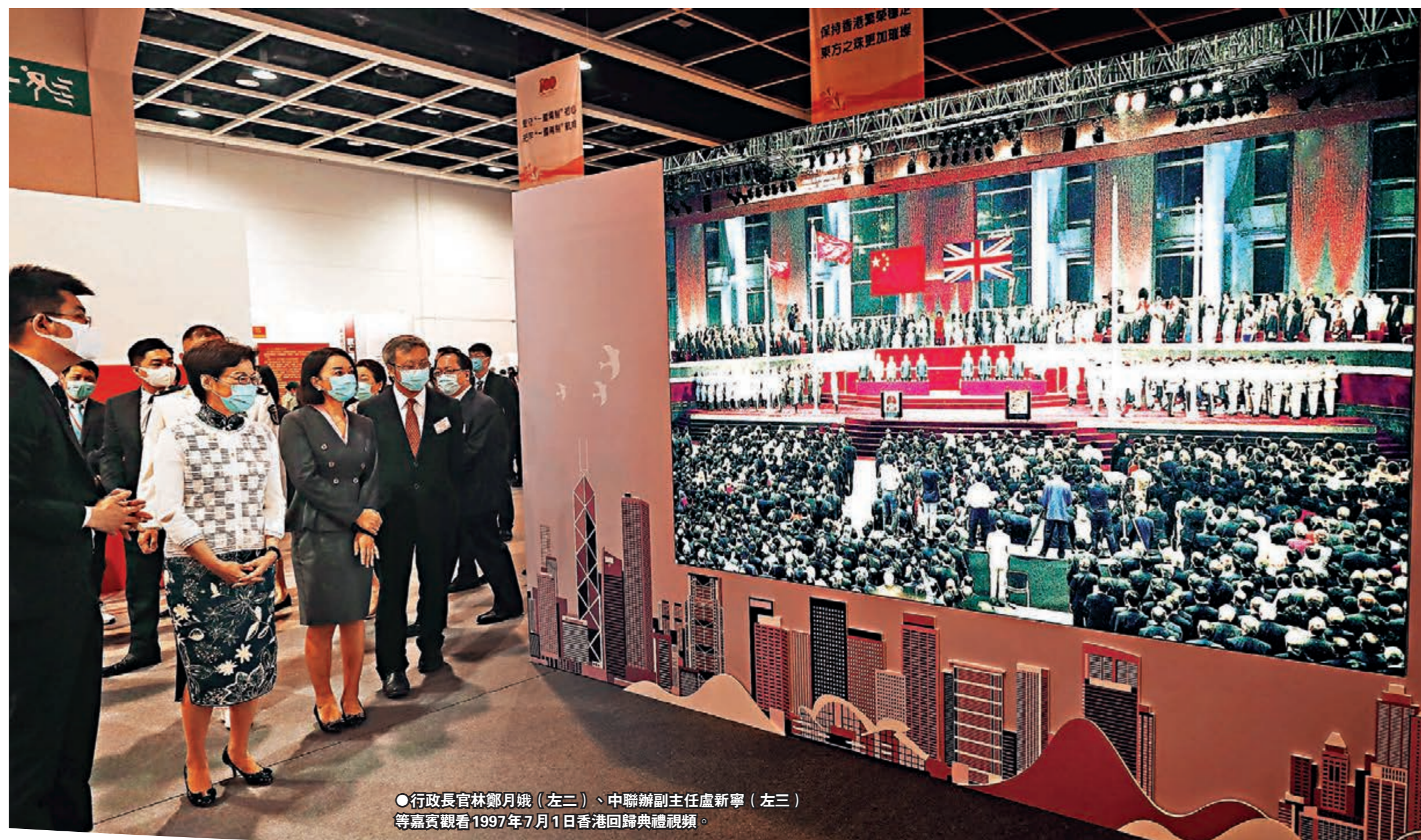
●行政長官林鄭月娥(左二)、中聯辦副主任盧新寧(左三)等嘉賓觀看1997年7月1日香港回歸典禮視頻。