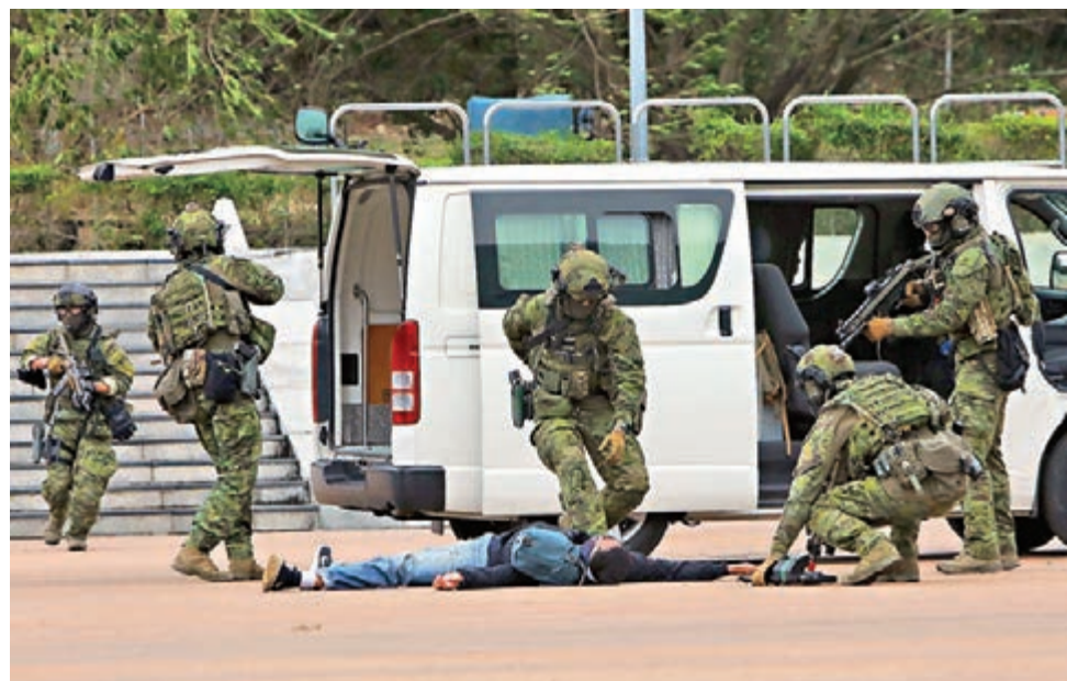
▶李家超強調，市民須在安全情況下配合警方執法。圖為今年4月15日國家安全日警隊進行的反恐演習。

李家超昨日以「政府全力打擊本土恐怖主義」為題發表網誌。他直言，2019年6月後發生的黑暴，破壞了香港整體安全，包括市民被無辜襲擊、公物被嚴重破壞、大量汽油彈被投擲、交通被嚴重癱瘓等，但更影響深遠的是，守法意識被嚴重破壞，本土恐怖主義更開始滋生。