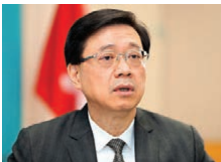
▲政務司司長李家超昨日發表上任後首篇網誌，強調政府會全面防範及打擊本土恐怖主義。