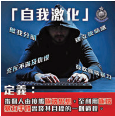
●香港警察fb發圖解釋何為「自我激化」。

香港文匯報訊（記者 甘瑜）為加強社會對反恐資訊的掌握，香港警察facebook專頁昨日向網民解釋「自我激化」的意思，指出「自我激化」是指個人由接觸極端思想，至利用極端暴力手段實踐其目標的一個過程，銅鑼灣日前發生的「孤狼式」恐襲就是一例。