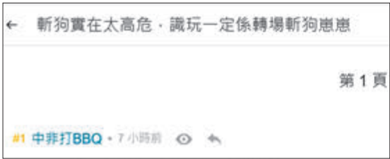
●連登仔網上煽動他人殺警察家人。網上截圖

翻查該網民發帖記錄，他上周五在「孤狼式」恐襲當日亦曾發帖稱，「一諗起嗰《死黑警》呢排行出街要提心吊膽就爽歪歪」；並於同日問「可以叫開心消園餐未」，似乎對警察受傷危殆感到高興；甚至發出「香港人有無可能『殺一警（察）百』？」的帖文，內文就寫到「Kill one police one hundred?（殺一警察一百）」；上周四亦曾發帖多謝有人「燒×禮賓府」，思想極端。