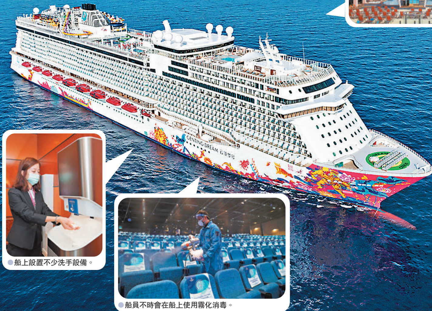
雲頂夢號郵輪及其設施。