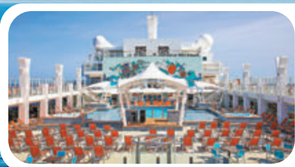
船上有不少露天設施。