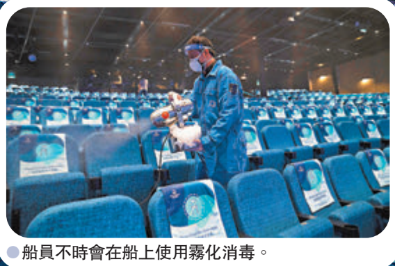
船員不時會在船上使用霧化消毒。