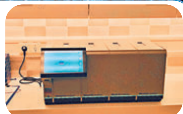
船上設有新冠病毒PCR核酸檢測儀器。