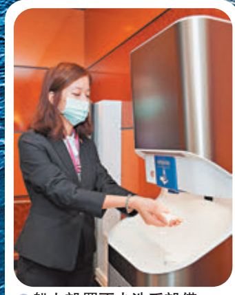
船上設置不少洗手設備。