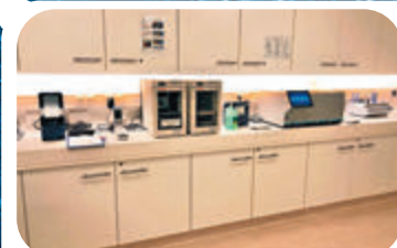
船上設有24小時運作的醫療中心。