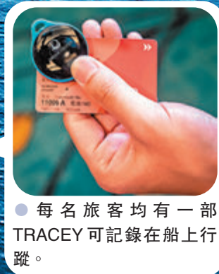
每名旅客均有一部TRACEY可記錄在船上行程。