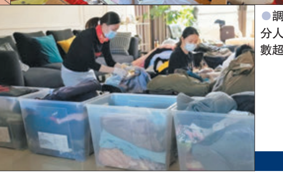
●調查指，大部分人的衣櫃衣物數超過500件。