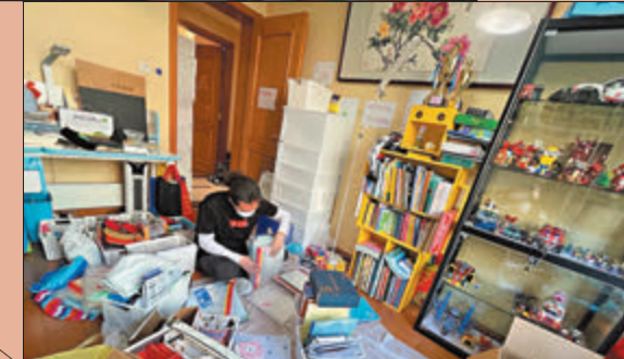
●3個收納師收拾75平米居所，一共約需8個小時。

事實上，收納產業發展十分迅速，據天眼查數據顯示，僅在「居民服務業」一欄裏，就有206家收納相關企業。另據中研普華發布的《2020整理收納白皮書》顯示，截至2020年，中國整理收納行業年產值已達1,000億元，成為極具潛力的新藍海。