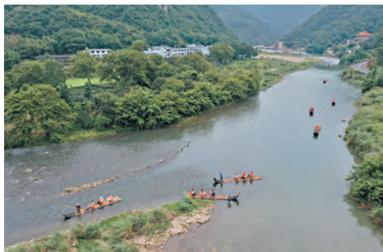
●財新中國通用服務業經營活動指數連續第14個月保持擴張。

香港文匯報訊(記者 海巖 北京報道)近期廣東等局部地區新冠肺炎疫情反覆拖累服務業復甦。最新公布的6月財新中國通用服務業經營活動指數(服務業PMI)降至50.3，雖連續第14個月保持擴張，但較5月大幅回落4.8個百分點，為2020年5月以來最低。此前公布的6月財新中國製造業PMI下降0.7個百分點至51.3。製造業和服務業PMI同時放緩，導致6月財新中國綜合PMI大幅下降3.2個百分點至50.6，亦為近14個月新低。這一走勢與國家統計局此前發布的PMI數據基本一致。