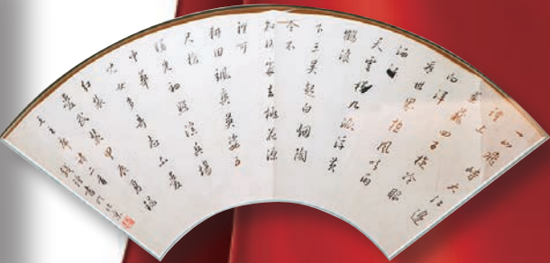
●李大釗行書《七言詩》。