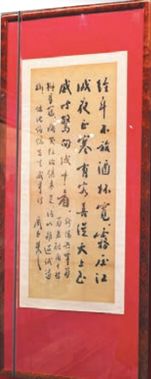
●周恩來行草書《錄沈鈞儒先生感事詩》。