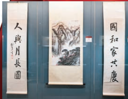
●陳獨秀作行書五言對聯。行書