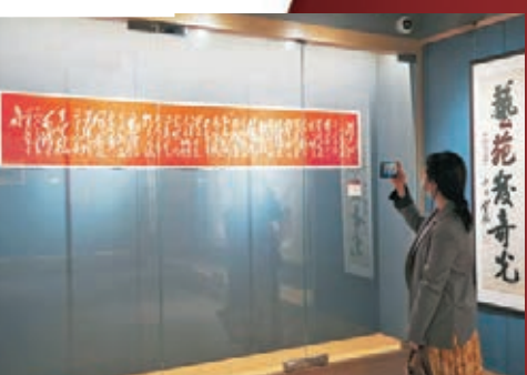
●觀者欣賞毛澤東《滿江紅》朱砂拓本。