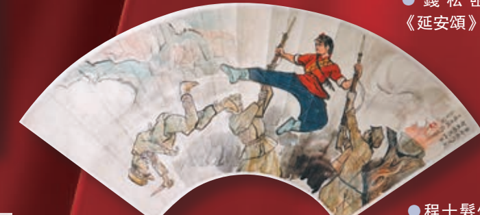
●程十髮作扇面《智取威虎山》。