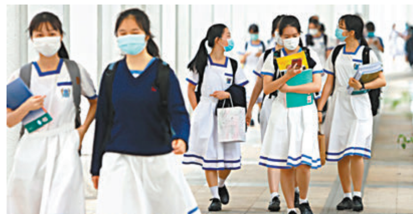
●穆家駿表示，教材同時也是很重要的加強國民身份認同的參考資料。圖為香港中學生。