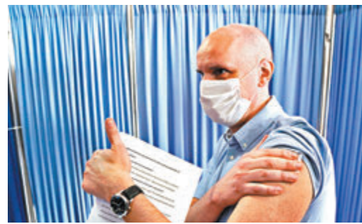
●豎起大拇指代表讚賞，是國際通用的肢體語言。

I think that food in that restaurant is terrible. So it's for me a firm thumbs down for eating out