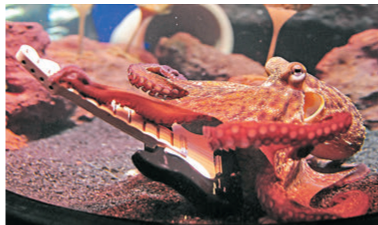
●八爪魚生活在水中，但仍有人相信「樹章魚」的存在。 資料圖片

數位原生代也需要了解數碼素養這一概念，並反思自己的數碼素養實踐(digital literacy practices)。