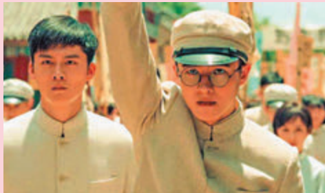
●劉昊然（右）飾演劉仁靜。