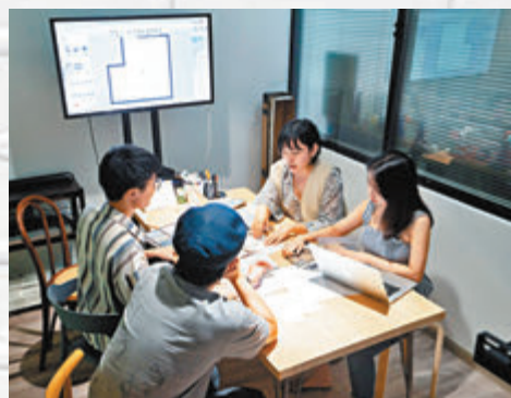
▲「五金少女」和團隊成員討論拍攝方案。