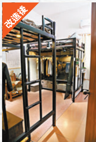
▲出租房改造前後對比。