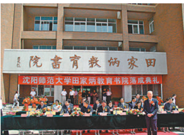
● 田家炳基金會經常撥資助給院校以提升教育質量。

在內地要看到「田家炳」的「足跡」也不難，浙江師範大學中就有「田家炳德育研究中心」，冀以培養德育人才，建設德