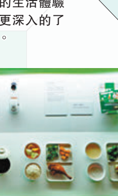
● 展覽展出機構特為長者設計軟餐的模樣。

「不單單是年輕人才可以愛美，老了為什麼就不會愛美了呢？」姜太說。除了外在的款式，工作室的康健服飾也隨着客戶的需要逐漸改良，比如關注到一些長者喜歡用牙籤，然後就在服飾上加上了口袋，從細節中提高他們生活的自主性，也給他們挽回尊嚴。