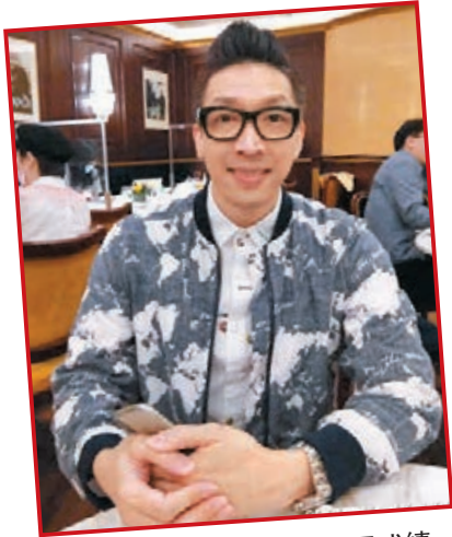
●煒唐為心願不斷努力，日見成績。