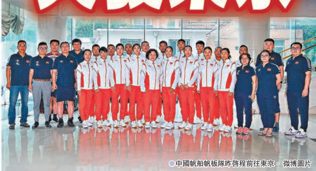
●中國帆船帆板隊昨啟程前往東京。