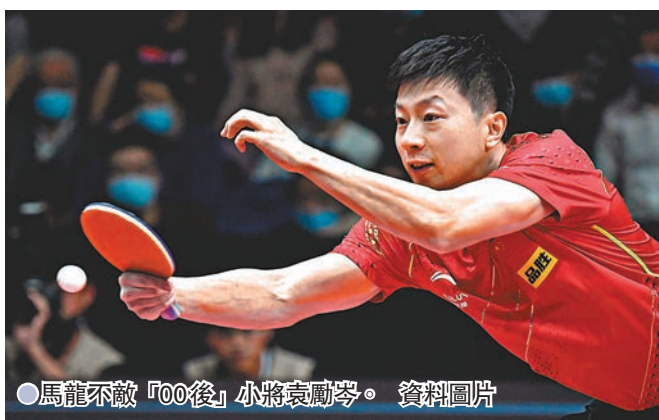
●馬龍不敵「00後」小將袁勵岑。 資料圖片

中國乒乓球隊奧運熱身賽9日繼續進行，女單世界第一陳夢一日雙賽，橫掃何卓佳後，又在晚間時段的比賽中再度不敵陳幸同。孫穎莎以4:1的大比分戰勝張瑞，報了前一日輸球的「一箭之仇」。男單大滿貫得主馬龍遭遇「00後」小將袁勵岑的強勁挑戰，儘管兩度化解賽點將比賽拖入決勝局，但馬龍還是不敵對手。