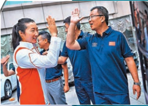
▶運動員與送行的中國帆船帆板協會工作人員擊掌告別。

中國帆船帆板隊昨日啟程前往東京，成為參加東京奧運會的中國代表團中第一支出征的運動隊。東京奧運帆船帆板賽事共設有10個項目，中國隊獲得其中8個項目的參賽資格，包括女子帆板、男子帆板、女子470級、男子470級、女子激光雷迪爾級、男子芬蘭人級、女子49人FX級和混合諾卡拉17級，其奧運參賽資格總數僅次於北京奧運會。