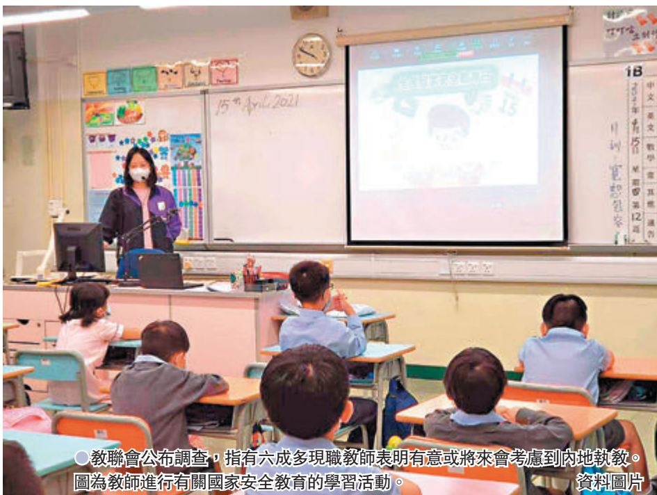
教聯會公布調查，指有六成多現職教師表明有意或將來會考慮到內地執教。圖為教師進行有關國家安全教育的學習活動。

教聯會指出，調查反映香港教師對北上執教取態普遍正面，但礙於申請資訊不足、程序繁複，令部分教師卻步。教聯會期望兩地政府可推出更多支援措施，鼓勵香港教師北上發展。