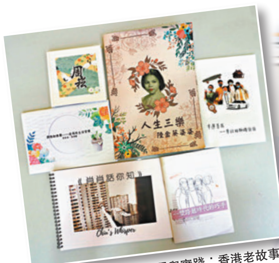
圖為浸大「服務學習與實踐：香港老故事書寫」學生課堂成果。