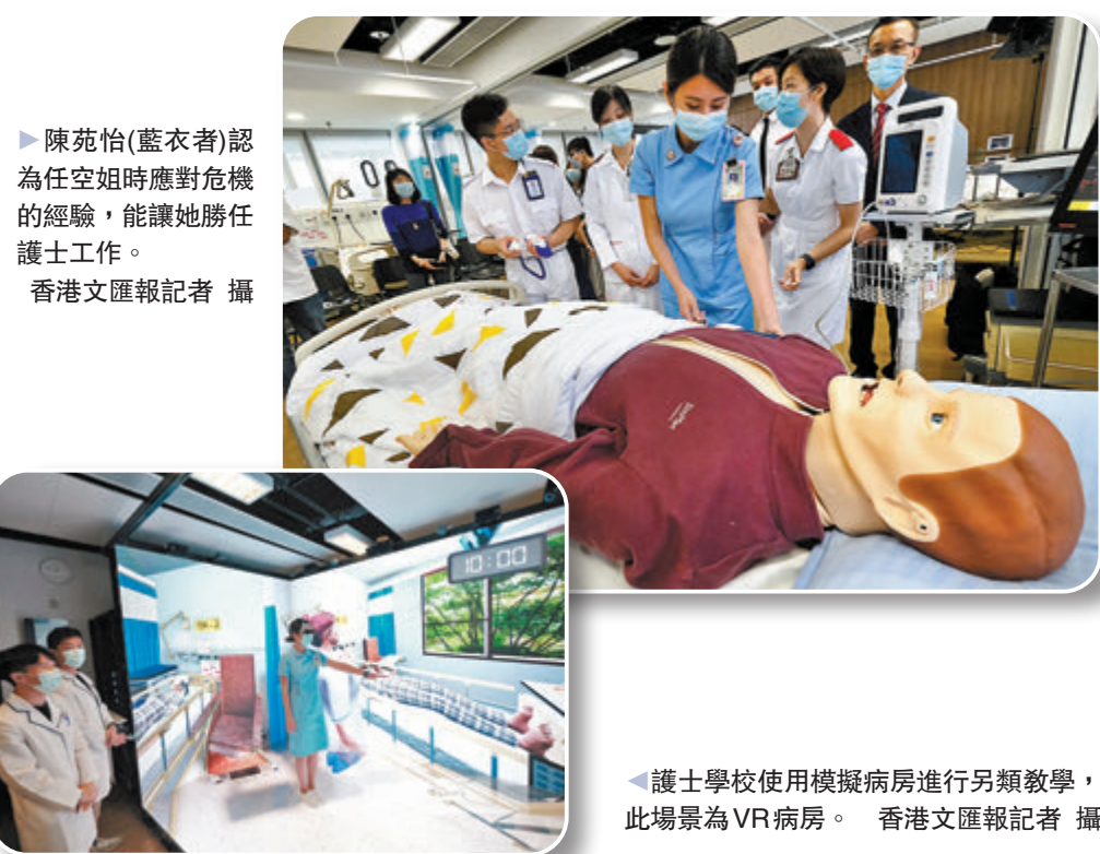
護士學校使用模擬病房進行另類教學，此場景為VR病房。

下周五(7月23日)東京奧運開幕當日下午5時，康文署在九龍公園體育館舉行「奧運直播區」啟動活動，