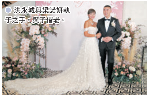
● 洪永城與梁諾妍執子之手，與子偕老。