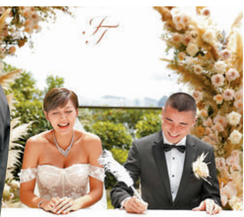
● 洪永城與梁諾妍簽紙結婚。