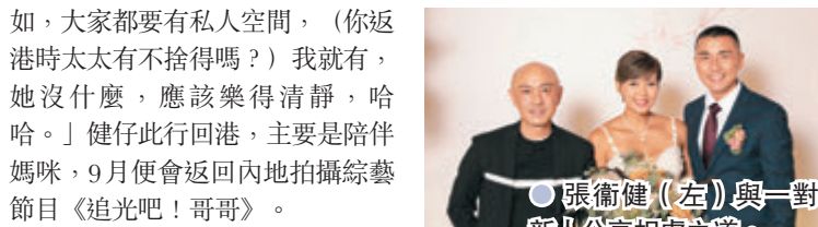
● 張衛健(左)與一對新人分享相處之道。