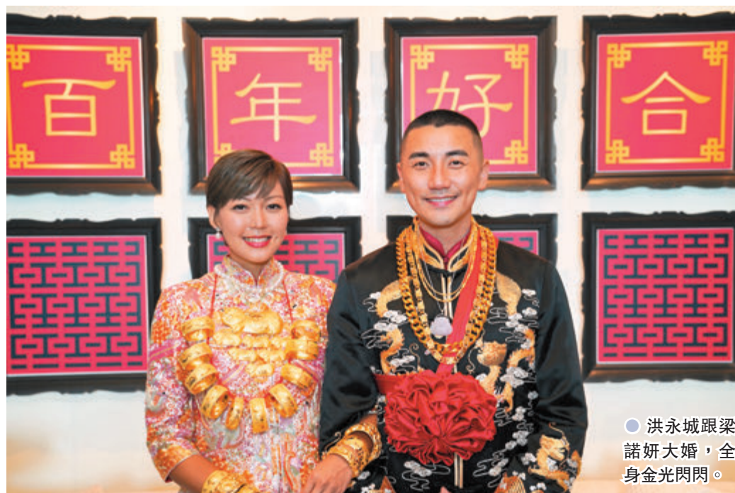
● 洪永城跟梁諾妍大婚，全身金光閃閃。