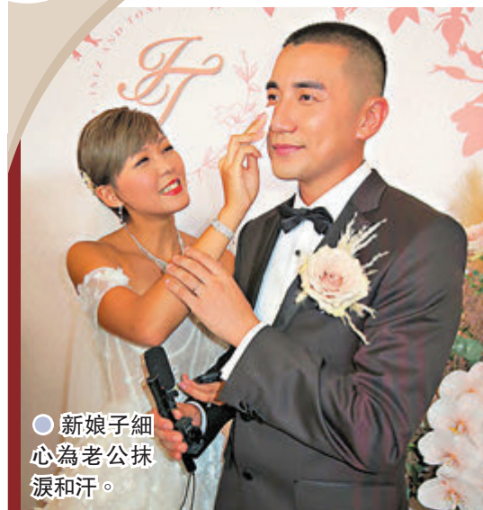
● 新娘子細心為老公抹淚和汗。