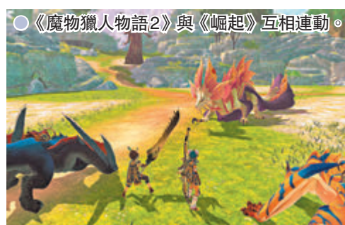
●《魔物獵人物語2》與《崛起》互相連動。

SIE早前落實兩大話題作《Death Stranding》與《對馬戰鬼》將分別於9月24日及8月20日推出PS5導演版，兩者均追加不少新內容及提升畫質。微軟早前在E3網上發布會介紹今後聯同Bethesda的多款新作，其中在PC大受歡迎的