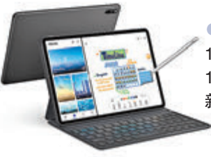
●MatePad 11 首度支援120Hz 超高刷新率。