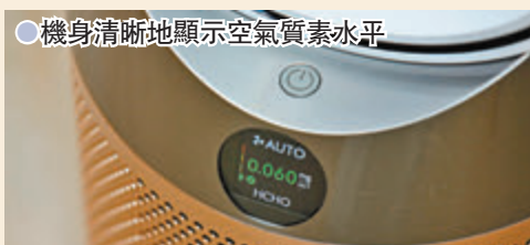
●機身清晰地顯示空氣質素水平