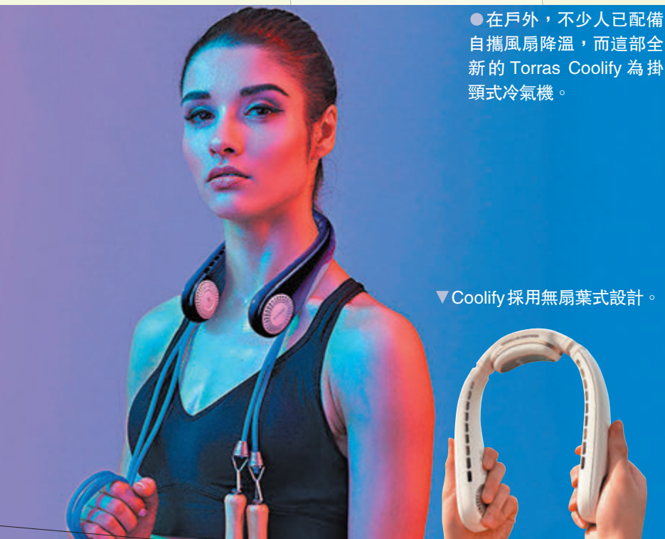
●在戶外，不少人已配備自攜風扇降溫，而這部全新的Torras Coolify為掛頸式冷風機。