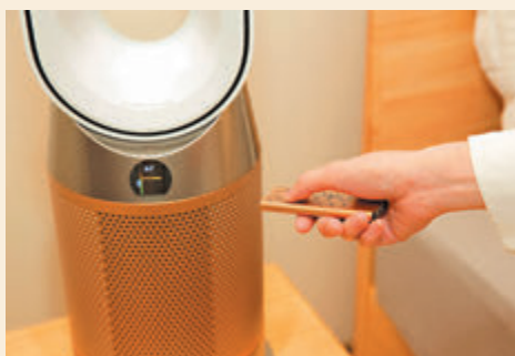
●用家可使用Link App全面控制淨化機及以語音控制啟動機器

而且，新產品還採用品牌Air Multiplier技術，可將淨化的空氣吹送至房間內每個角落，其自動模式容許機器維持指定的溫度及空氣質素水平，用家可以使用品牌Link App全面控制淨化機及以語音控制啟動機器，應用程式適用於iOS及Android，支援追蹤室內污染、溫度和濕度，並提供維修支援和故障診斷。