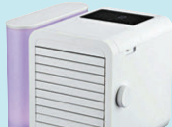
●Aurora Cool迷你你設計，方便攜帶。

現在，冷風機在香港款式及種類繁多，很多用戶都會將這些產品作室外冷氣般使用。最近，iNNOTEC推出全新智能迷你冷風機Aurora Cool，採用輕觸控式操作面板，LED功能顯示，備有三種送風模式，平常、自然及睡眠模式選擇，並設有7色幻彩燈，側面備有可拆式1公升特大水箱，可設12小時時間掣，靜音操作，同時新型號IC-3868還備有空氣淨化功能，在送出冷風的同時，送出的空氣更清新。