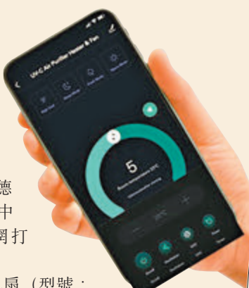
●用戶可使用手機應用程式遙距操作。