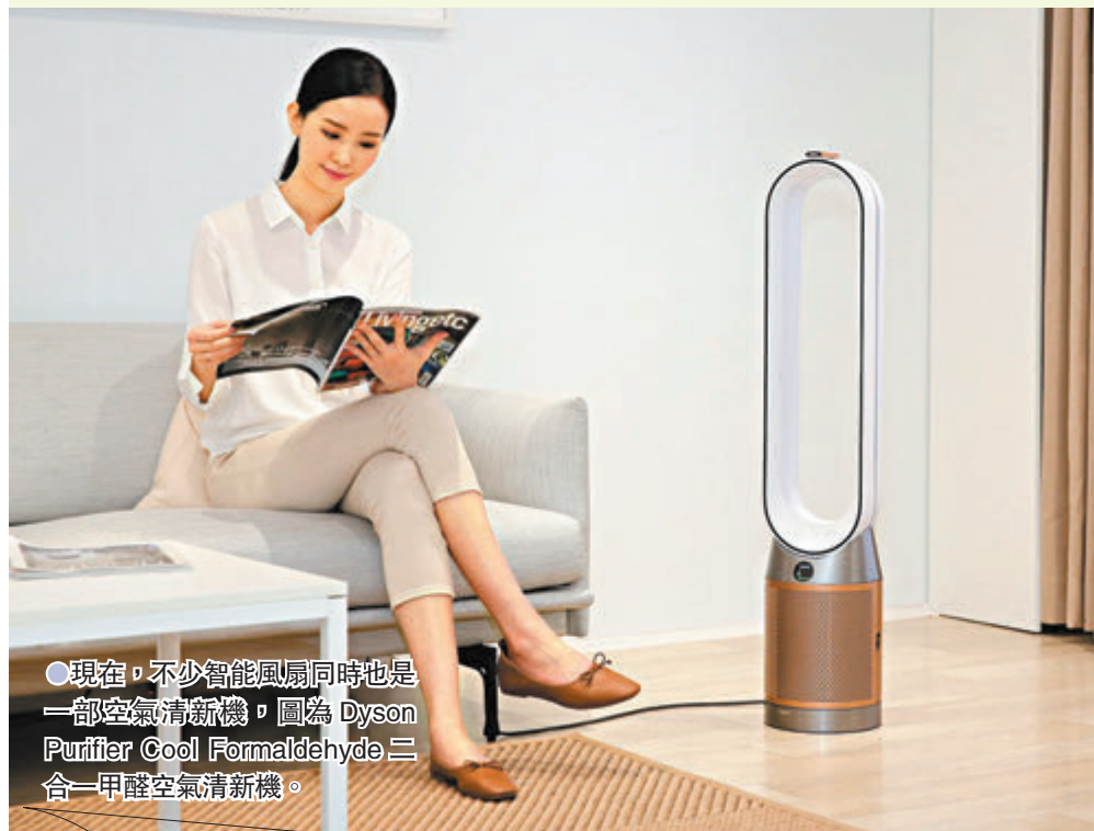
●現在，不少智能風扇同時也是一部空氣清新機，圖為 Dyson Purifier Cool Formaldehyde 二合一甲醛空氣清新機。

天時暑熱，氣溫動輒攝氏30度以上，香港天文台近日屢次發出酷熱天氣警告，如走到街上行個圈或許已汗流浹背，但此時亦正是外出活動的好時機！不過，大熱天時，大家記得要做好消暑的準備，避免中暑。因此，今年不少科技品牌特別推出多款消暑降溫神器，當中如配備多功能的智能風扇、冷風機等，讓你室內戶外都能感到清爽涼快。